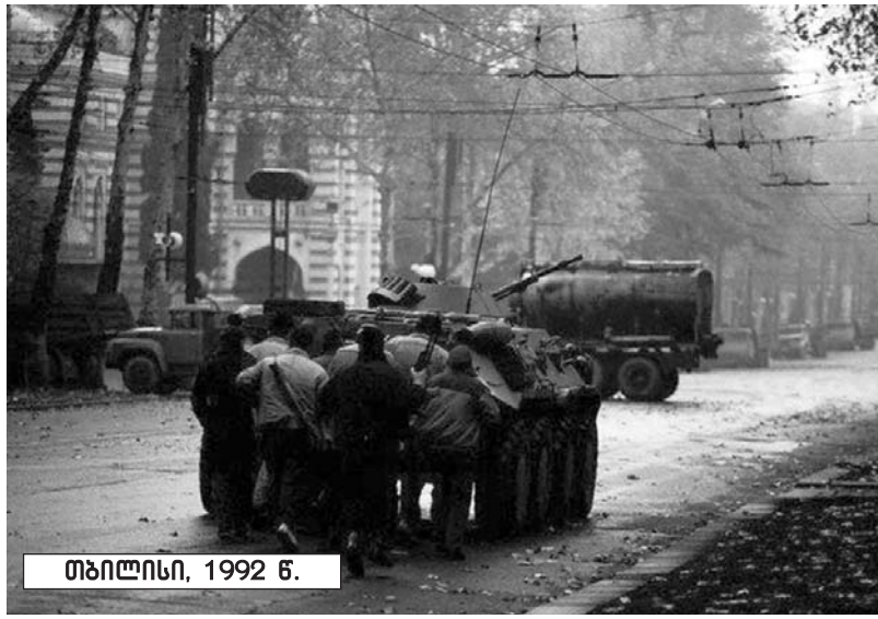
თბილისი, 1992 წ.

— კვლავ დაუბრუნდეთ იმ მნიშვნელოვან საკითხს, რაც საზოგადოებას ძალიან ადევნებს. ეს იმის სიმბოლოა, რომ კაშხალში, სადაც ნაპრალია და იგი შეიძლება მთლიანად გაინგრეს. ოჯახური ძალადობა ინდიკატორია იმისა, საზოგადოებაში, უკმაყოფილების დონეზე, რა დუღილის პროცესები მიმდინარეობს. ეს, ჯერჯერობით, მხოლოდ ოჯახებში ვლინდება, ანუ წერტილოვნად, ხვალ შეიძლება ქუჩაში გამოიფაროს. გვაქვს მძიმე სოციალური და ეკონომიკური ფონი, სრული დაუცველობის განცდა. ეს განცდა, ქართველებს, თავს არ გვანებებს. ჩვენი საზღვრების 45% დემარკირებული არაა, მკვიდრი მოსახლეობის დიდი ნაწილი კვლავაც ტოვებს ქვეყნის ფარგლებს და ემიგრაციაში მიდის. მიზეზი, შიდა მოუწესრიგებელი კანონმდებლობა და პირველ რიგში, კონსტიტუციაა, რომელსაც 2004-დან 2010 წლამდე თავის ჭკაზე ჭრიდნენ და კერავდნენ, მასში 21 ცვლილება შევიდა, 2010 წლისთვის კონსტიტუციის რეფორმირება მოხდა. დღეს კვლავ რეფორმირებაზე საუბარი იყავს ამის მერე დღის წესრიგში დგება სრულიად ახალი რედაქციის კონსტიტუციაზე მუშაობის დავალება. ანუ ეს, არასტაბილურობის განცდის კიდევ ერთი ძალიან სერიოზული ფაქტორია. ამ წლების მანძილზე რეპრესიული მანქანის საეიზიტო ბარათი იყო ის, რომ მუდმივად საკანონმდებლო ბაზას რევდნენ, რათა საზოგადოება ვერ დაწეოდა იმ ცვლილებებს, რომელსაც „ნაცმოდრობა“ კონვენერული სისტემით ახვევდა თავს, რაც ჩვენი სამოქალაქო უფლებების მუდმივ შეზღუდვაში ვლინდებო-