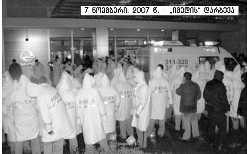
7 ნოემბერი, 2007 წ. — „ნიჰილიზ“ ღარბევა

მას პოლიტიკურ ორგანიზაციად ვერ განვიხილავ. როდესაც ამბობენ, რომ შეიძლება „ნაცმოდრობა“ ხელისუფლებაში დაბრუნდეს, ეს იმას ნიშნავს, რომ მათ საზოგადოებაში დასაყრდენი უნდა ჰყავდეთ. თუ მათ ეს დასაყრდენი მართლაც ჰყავთ, მაშინ ჩვენ დაავადებული ერი კი არა, არამედ მკვდარი ერი ვყოფილავართ. — პრობლემა ისიც ხომ არ არის, რომ მთავრობებმა მოახერხეს საქართველოს კანონმდებლობიდან დემოკრატიის ელემენტები გაეჭროთ? ვგულისხმობ, რეფერენდუმებს, სახალხო გამოკითხვებს და ა.შ. — დიახ, რა თქმა უნდა. ეს აღარ ხდება იმიტომ, რომ რეფერენდუმების წართულებულია. მთელ რიგ საკითხებთან დაკავშირებით, საერთოდ, რეფერენდუმში აკრძალულიცაა და, რაც ყველაზე მთავარია, ამ მიმართულებით, თავად საზოგადოების აქტიუობაც არაა ძლიერი. მაშინ, როდესაც დასავლურ დემოკ-