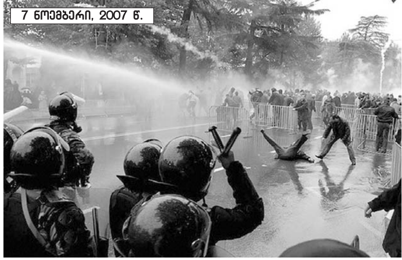
7 ნოემბერი, 2007 წ.