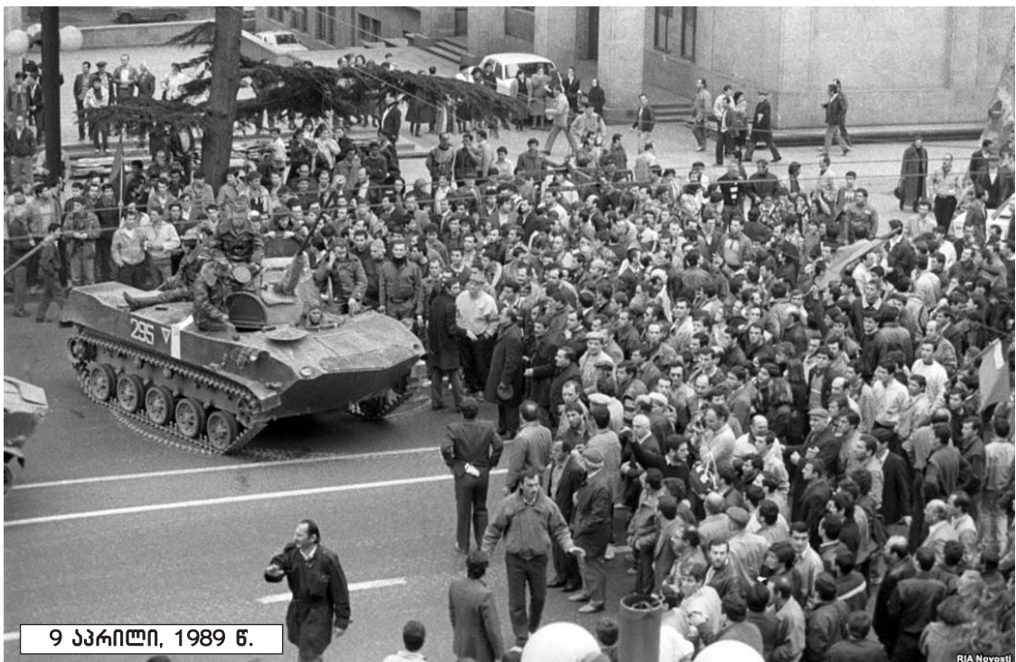
9 აპრილი, 1989 წ.

პირველი პრეზიდენტი ზვიად გამსახურდია უდგას. ამ პერიოდის რა შეცდომებზეც არ უნდა აპელირებდნენ ოპონენტები, ფაქტი ფაქტად რჩება, თუმცა 1991 წლის მონაპოვარი, ჩვენივე მოქალაქეების მიერ, გარედან მართული პროცესების საფუძველზე დაიმსხვრა. თუკი ჩვენი თაობა, სამართლიანობის აღდგენის საკითხზე არ ვიზრუნებთ და 1991 წლის მოვლენებს სამართლებრივ შეფასებას არ მივცემთ, მომავალი თაობები კიდევ უფრო რთულ ვითარებაში აღმოჩნდებიან. თუ სამართლიანობა არ იქნება, მშვილობა არასოდეს იქნება. ქვეყანაში, სამართლის პური, ერთხელ და სამუდამოდ უნდა გამოცხვდეს. დარწმუნებული ვარ, 2004 წელს, თებერვალში, სააკაშვილის მიერ შექმნილ 1991-93 წლების მოვლენების შემსწავლელ სახელმწიფო კომისიას რომ ემუშავა და რეალური სურათი დაედო, დღეს, ასეთ მდგომარეობაში არ ვიქნებოდით. გამსახურდიას ხელისუფლების დამხობის დღიდან ორი ხელისუფლება გამოვიცვალეთ და მესამეს ვეგუებით. ვხედავთ, რომ მათ ლეგიტიმობასთან დაკავშირებით, ყოველთვის, კითხვები გვრჩება, როგორც შევარდნაძესთან, ისე სააკაშვილთან მიმართებით. თუ ისტორიული მეხსიერება არ აღდგა, ამ მთავრობასაც ზუსტად იგივე ელის, რაშიც შევარდნაძე და სააკაშვილი გადაეშენნენ. იმედი მქონდა, რომ ღარიბაშვილი ყველა ღონეს იხმარდა, რათა ქვეყანაში ეროვნული თანხმობა განმტკიცებულიყო. არამის სისხლის დაღვრა და ციხეში ამოკლავთ არ გვინ-