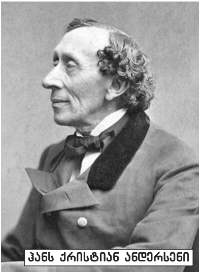
ჰანს ქრისტიან ანდერსენი