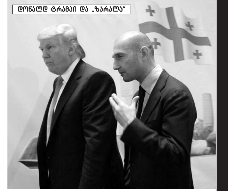
დონალდ ტრამპი და „ზარალა“

ვინ დაავალა. დასაკითხია კრიმინალური პოლიციის დეპარტამენტის უფროსი ლევან გვაზავა და ა.შ. გამოძიებულს ჩემთან საუბრისას წამოსცდა, ამოღებულ მასალებში მითითებული იყო ოპერატიული ინფორმაციის საფუძველზე, „ცხველ კვლზე“ გატარებული ღონისძიების შედეგად დააკავეს გამტაცებელი. ესეც ჩემს სიმართლეს ადასტურებს. საქმე იმაშია, რომ ეს ღონისძიება მართლაც გატარდა, რომელიც გლდანის რაიონის პოლიციამ ჩაატარა, აქ უშუალოდ სამინისტრო არაფერ შუაში იყო, ხელმძღვანელობამ კი მომაცუცა, ჩვენი სამსახურის ჩატარებულ ოპერაციად გაასაღა. უარს მაინც ვერ ვიტყვოდი, სამსახურში ახალი დაბრუნებული ვიყავი, ამით მიზეზს მივცემდი სამსახურიდან ისევ გავეშვი. მაშინვე წერილობით მივმართე სამინისტროს ხელმძღვანელობას, მაგრამ პასუხი არ მაღირსეს, საერთოდ არ გამაპარეს ამ საქმეს. ხელისუფლების შეცვლის შემდეგ წერილი მივიღე, თქვენი საქმე წარმოებაშია, ინტენსიურად მიღის გამოძიება, არავითარი გამოძიება, ყველაფერი გაჩერებულია. აღარც მიმიკითხებია, რა აზრი აქვს, ტყუილად ჩერდება უნდა მოვიშალო. მგონია, რომ ეს ყველაფერი სოსო ალავეიძისგან მოდის, სანამ რაიმე ბერკეტი აქვს, დარწმუნებული ვარ ბარიერს შე-