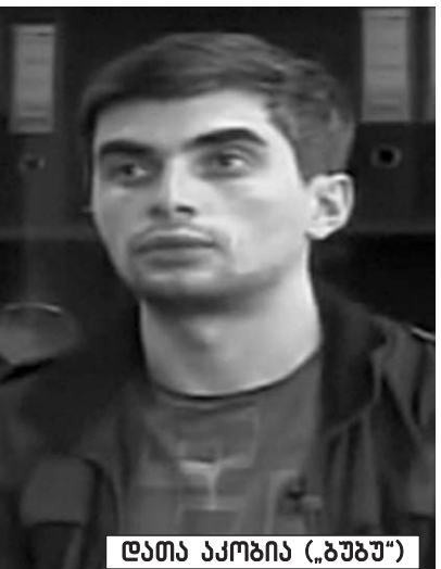
ლათა აპოზია („ზუბუ“)