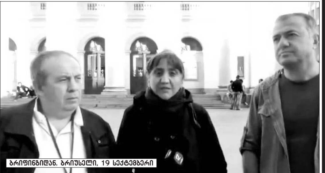
ბრიფინგიდან. ბრიუსელი, 19 სექტემბერი

„და მე ჩავთვალე, რომ ეს სულაც არ მოხდა შემთხვევით“, — ამბობს ქალბატონი ირმა და მე მიჩნდება კითხვა: რატომ