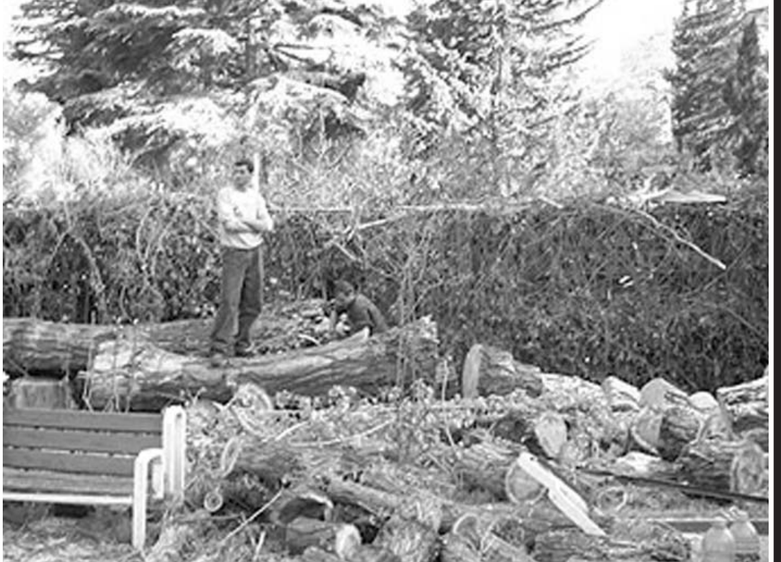
აი, ასე გამოიყურება დღეს ბუკიას ბაღი