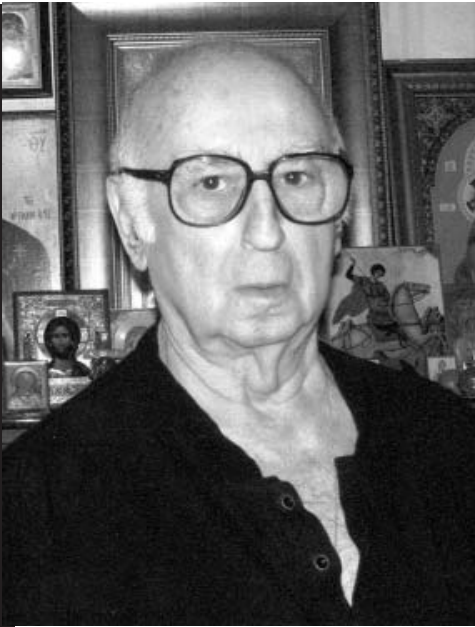
„საერთო გაზეთის“ სტუმარია პოეტი რეზო ავაშვიძე.