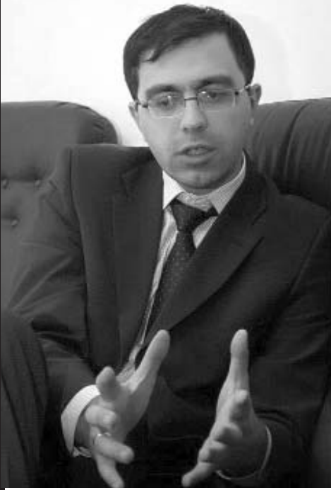
გვესაუბრება „თავისუფალი საქართველოს“ ლიდერი პასა პაპიაშვილი