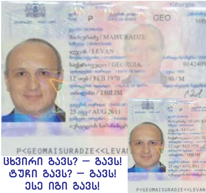
სხვირი ბავს? – ბავს! ტუჩი ბავს? – ბავს! ესე იზი ბავს!

სიყვარულით ვუვლიდი, აქედან რომ მიდიოდნენ შენს მზეს ფიცულობდნენ – ეს რა ოქროს გულის კაცი ყოფილაო.