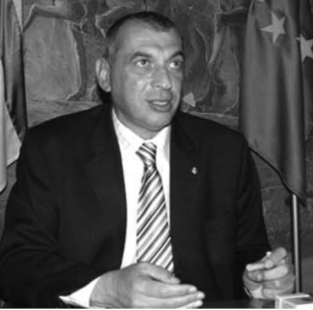
ვესაუბრებით საქართველოს განათლების მინისტრის მოადგილეს ბატონ დავით ზურაბაძეშილს

ბატონო დავით, ბოლო დღეებში უმაღლეს სასწავლებლებთან დაკავშირებულმა სიახლეებმა, რომელიც განათლების მინისტრმა განმარტა, ცოტა არ იყოს გაურკვეველი განწყობა ჩამოაყალიბა აბიტურიენტებსა და მათ შრობებში, მათთვის გაუგებარი გახდა ერთი სიახლე, რას ნიშნავს სწავლა გაძვირდება? ქვეყანაში, სადაც მილიონამდე სოციალურად დაუცველი ადამიანი ცხოვრობს, მათ ეს საკითხი ხომ ყველაზე მეტად აწუხებთ, იქნებ განმარტოთ, სინამდვილეში რა და როგორ მოხდება?