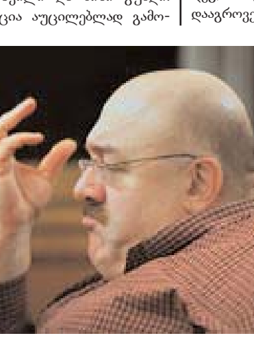
საყენებელია, თუ ხალხი მონიღომებს და სწორ ნაბიჯებს გადადგამს, ყველაფერი კარგად იქნება, ანუ ერთხელ და სამუდამოდ გავისტუმრებთ სააკაშვილის რეჟიმს პოლიტიკური მოუსაველეთში. სხვათა შორის, საპროტესტო აქციების დაწყებას თურმე ბევრი რიგითი ნაციონალიც სულმოუთქმელად ელოდება. ამ აქციების მხარდასაჭერად ისინიც აუცილებლად გამოვლენ, მათაც ხომ ისევე უჭირთ, როგორც დანარჩენ მოსახლეობასო.

ბა ჰყავთ დასაცავი, აბა, ფულს ტყუილად ხომ არ გადაუხდიან? მსგავსი მობილიზაცია გასულ წელს, საპროტესტო აქციების დაწყებამდეც ყოფილა. იმ აბჯარასხმული, ნიღბიანი რობოტების უმეტესობა, რომლებმაც სასტიკად დაარბიეს რუსთაველის გამზირზე აქცია, ზუსტად ეს სხვადასხვა სპორტული დარბაზებიდან აყვანილი დაკუნთული ბიჭები იყვნენო. ისინი ძირითადად, რაიონებიდან ჩამოიყვანეს, რომლებსაც საერთოდ არაფერი აინტერესებდათ, რადგან ფული მისცეს, ვალები გაუსტუმრეს, ავტომანქანები უყიდეს და ამიტომ მზად იყვნენ ყველაფერი გაეკეთებინათ. ამ ყველაფრიდან კარგად ჩანს, რა მდგომარეობაშია სააკაშვილი და მისი გუნდი. ეს სიტუაცია აუცილებლად გამო-