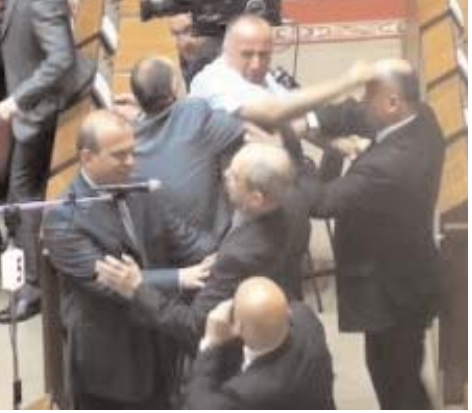
თავმოყვარეობაშელახულ კაკოს პასუხი დაუბრუნებია პრეზიდენტისთვის და ირაკლი

კაკო ძმას გამოქომაგებია – ტყუილებს უგონებენ, თორემ ჩემი ძმა ბროლივით სუფთააო, რაზეც გულობს სააკაშვილს კაკოსათვის სილა უთავაზებია, მერე კი კოკასა და მისი ძმის მშობლისთვის ცხრასართულიანი მოკითხვა გაუგზავნია დესერტად.