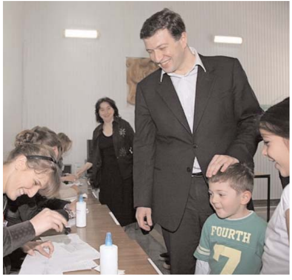
სახელმწიფო იყოს. ასე რომ, ძალზე ბევრი ფაქტორია, რის გამოც სააკაშვილის ხელისუფლებას აღარ ენდობიან და ის უნდა წავიდეს.

საქართველოში რომ დემოკრატია არ არის, ეს სამომავლოდ შეიძლება ძალზე საშიში გახდეს. თუ აქ არჩევნების შემდეგ იგივე ხელისუფლება დარჩა ეს ნიშნავს, რომ 2023 წლამდე ხელისუფლება აღარ შეიცვლება. აქედან გამომდინარე, საქართველოში შეიძლება იმაზე გაცილებით უფრო რადიკალური პროცესები განვითარდეს, ვიდრე 2007-2011 წლებში იყო, რაც საგრძობად შეარყევს დასავლური ღირებულებების სიმყარეს კავკასიაში. ეს ძალზე არ აწყობს ევროპასა და ამერიკას, რადგან საქართველო მათი იდეოლოგიის დასაფრენი და გამაგრებელი. ამ ქვეყანაში მოსახლეობის რადიკალური გამოსვლები, თუნდაც იგივე პროცესების განვითარება, რაც ლონდონსა და საფრანგეთში ხდებოდა, ნიშნავს იმას, რომ დასავლეთი კარგავს პერსპექტივას საქართველო მათი გავლენის ქვეშ მყოფი