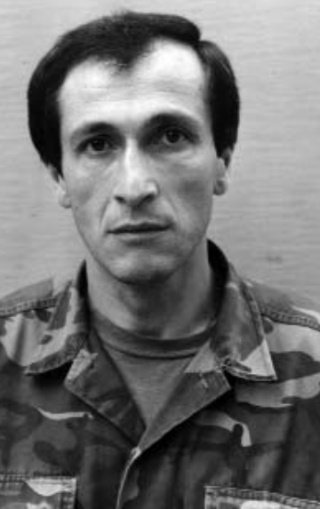
შეიარაღებული ძალები აკონტროლებდნენ.

წის სადგურში უამრავი ხალხი ირდოდა. ჩვენი დანახვა ისე გაუხარდათ, რომ შემახილებითა და ტაშით გავცვიდნენ. 21 სექტემბერს უშვლიანი ოჩამჩირაში ჩავიდა. ის დამე სპეცრაზმმა და სატანკო ბატალიონმა სოფელ ლაბრის ომ ნაწილში გაეთიხნენ, რომელსაც ჯერ კიდევ ჩვენი