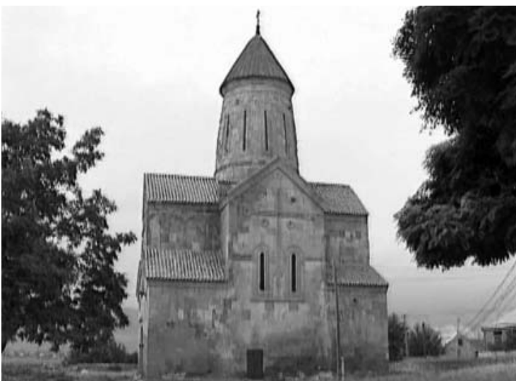
მეტეხის „ყოველადწმინდა“, მისი რელიეფი და სამრეკლო.

მეტეხის „ყოველადწმინდა“ XIII საუკუნის ჯვარ-გუმბათოვანი ტაძრების ალი-კვალია თავისი გვერდებით, მაგრამ მისი პერანგი გაცილებით ღარიბულია „წულრულაშენთან“, „ფიტარეთთან“, „იკორთასთან“, „პუჯაბთან“, „ქვათახეთთან“ და, თუ გნებავთ, მეზობლად მდგარ „ერთაწმინდასთან“ შედარებით. ეს უთუოდ გვიან შუასაუკუნეებში გაწეული დიდი რესტავრაციის