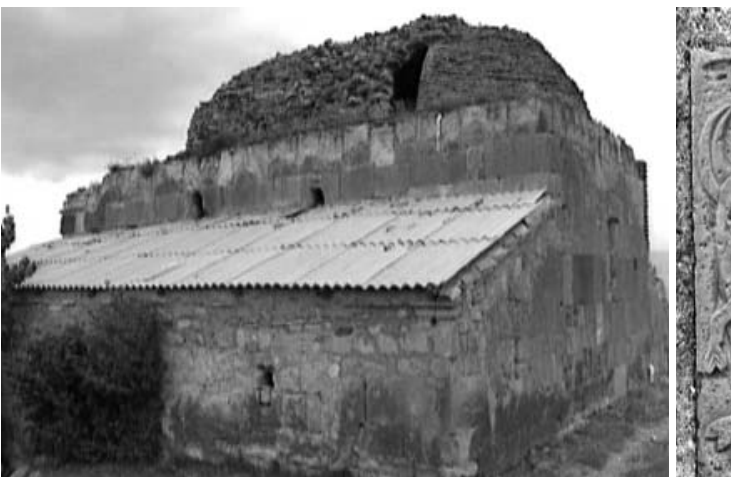
ნიაბის „წმინდა გიორგი“ და მისი რელიეფები.

ბაა ამოკვეთილი ჩალისფერ ქვასზე: წრის სამ მეთხედზე ღობი და ორი გაქცეული ხარია, წრის ერთ მეთხედზე – გაფითილი რტო, ხოლო წრის შუაგულში – მედალიონში ჩასატული ნათლისმცემელი (?)... სიუჟეტის სიმბოლური ახსნა ჭირს. ამავე ჩრდილოეთ ფასადზე ორგან ე.წ. ბოლნური ტომოკლავა ჯვარია ჩასმული, რომელთაგან ერთი – ჩალისფერ ქვასზე ამოკვეთილი – მეტად მშენიერია. სამი ასეთი ჯვარია გამოსახული გვერდიგვერდ აღმოსავლეთი სარკმლის თავსართზე, რაც გვეკვებს, რომ ტაძარი თავიდან სამების სახელზე იყო აგებული, ხოლო წმინდა გიორგის სახელზე აღდგენის შემდეგ აკურთხეს.