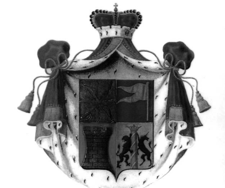
ბაღვაში - ორბელიანთა საგვარეულო გერბი