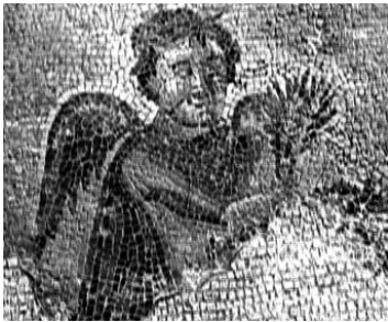
ძალისი. ანტიკური ტაძრისა და აბანოს იატაკის მოზაიკა