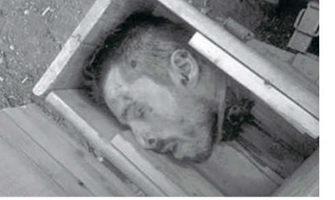
დონეცკში სახალხო მოლაშქრების დედაებს შეილებს მოჭრილი თავები გაუზავენს!

„დონეცკში, ლუგანსკში და დონეცკის ოლქის სამხრეთში ხანგრძლივი ბრძოლების გათვალისწინებით, ვშიშობთ, რომ დროლევილა რიცხვი კვლავ გაიზარდება“, – განაცხადა სამმართველოს ვეროპის ბიუროს ხელმძღვანელმა ვინსენტ კოსტელმა.