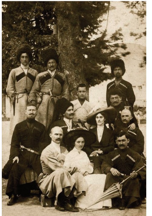
ფოტოზე: აფხაზურ-ქართული სანათქაფი. 1910 წელი.