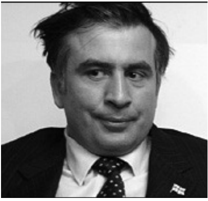
“არჩევნების მეორე ტურის შემდეგ ქვეყანაში დიდი დაჭერები დაიწყება”.

“კიდევ არაერთი საქმე ამოტივტივდება, რომლებიც დღეს გარკვეული ობიექტური თუ სუბიექტური მიზეზების გამო თაროზეა შემოდებული”.