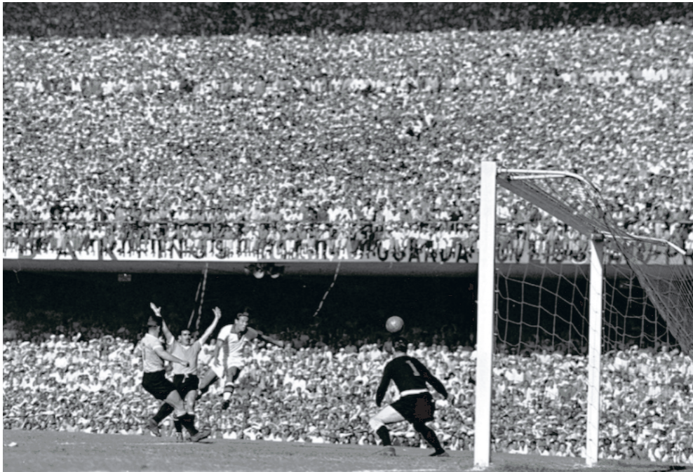
(ლენინდა "მარაკანას" – დიადი სტადიონის უცნობი წყევლა)

სტადიონი "მარაკანა", რომელიც რიო დე ჟანეიროში მდებარეობს, მსოფლიოში ყველაზე ლეგენდარულ არენად მიიჩნევა, თუმცა ბევრმა არ იცის, საიდან აქვს ასეთი პოპულარობა ამ სტადიონს. სტადიონები ლეგენდარული საკუთარი ისტორიიდან გამომდინარე ხდებიან. 2014 წლის მსოფლიო საფეხბურთო ჩემპიონატის ფინალი სწორედ "მარაკანას" სტადიონზე გაიმართა, რაშიც ბრაზილიის ნაკრებს უკვე წილი არაფერზე ელო... ბრაზილიის საფეხბურთო ნაკრები საბათის მის სამშობლოში გამართული ჩემპიონატი კიდევ ერთ დიდ ტრაგედიად იქცა, რამაც ღამის თვითმკვლელობამდე მიიყვანა გულშემატკივართა ნაწილი! ბრაზილიის ნაკრების საშინაო უბედურება კი იმ შორეულ 1950 წელს დაიწყო, როცა ამ ქვეყნის ნაკრები მართლაც საუკეთესო ფორმაში იმყოფებოდა და მის ტრიუმფს თითქოს წინ ვერავე ვერ უნდა გადადებოდა. მაგრამ ბედისწერის ქაღალდით თურმე სულ სხვაგვარად ფიქრობდა... მაშ ასე: გავივით თუ რატომ უნდა ყველა ფეხბურთელს ამ დიად არენაზე თამაში, თუმცა, არა მგონია, რომ ეს არენა სანუკვარად იქცევს როდისმე ბრაზილიის ნაკრებისათვის. ფეხბურთის სპეციალისტებისა და ფანტიკურად განწყობილი გულშემატკივრე-