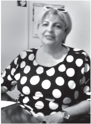
94-ე ბაგა-ბაღი „ფერია“ თბილისში, კუკიის დასახლებაში, ჭალადიდის ქუჩაზე მდებარეობს. ბაღში პატარების აღზრდა-სწავ-

ქციონირებდა, შემდეგ თანდათან გაფართოვდა და ახლა უკვე 4 ჯგუფია, 3 ასაკობრივი, ხოლო ერთი ბაგის ასაკის. შენობა მართალია ძველია, მაგრამ იგი გარემონტდა, შეიცვალა ინფრასტრუქტურა, მონესრიგდა სან-ტექნიკა, დამონტაჟდა ცენტრალური გათბობის სისტემა, კეთილმოეწყო ოთახები და აღიჭურვა თანამედროვე ინვენტარით. წლეულს, ბაღი სკოლაში 22 ბავშვს გააცილებს.