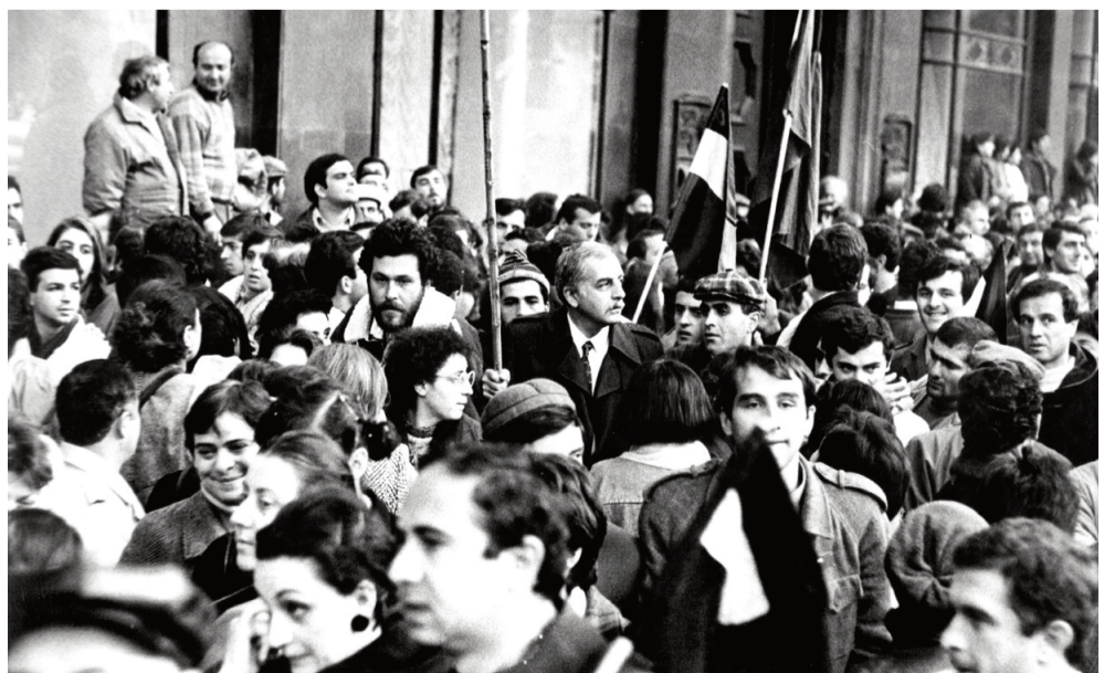
ფოტოგრაფი, რომელიც პირველად შექმნილია, მაღალგაზრდილია ფირილის ავტორის მიერ