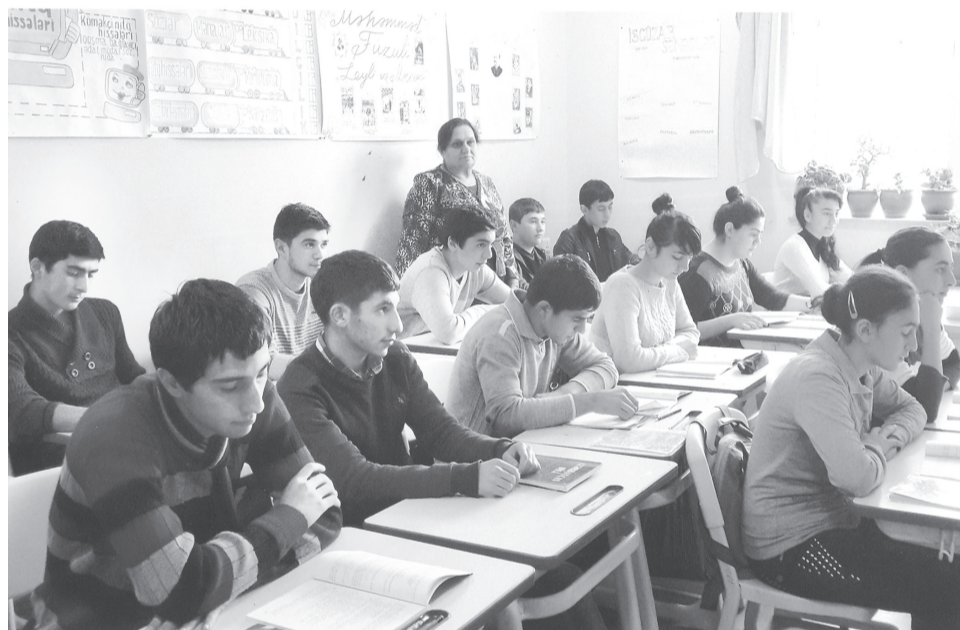
აზერბაიჯანული ენის გაკვეთილზე კლასში

სკოლა არის ოთხსართულიანი. პირველ სართულზე სკოლის ბუფეტი, სპორტული დარბაზი, მანდატურის