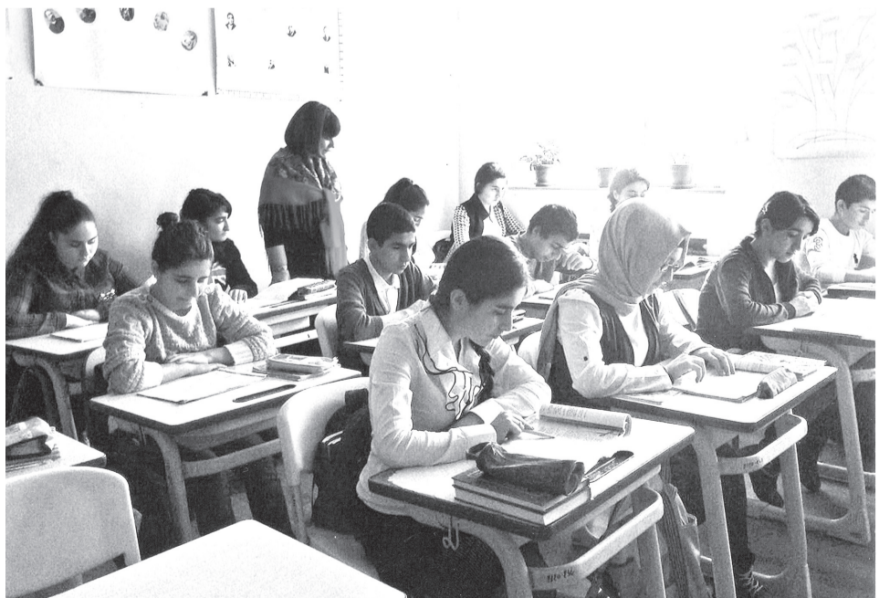
ქართულის გაკვეთილზე X კლასში