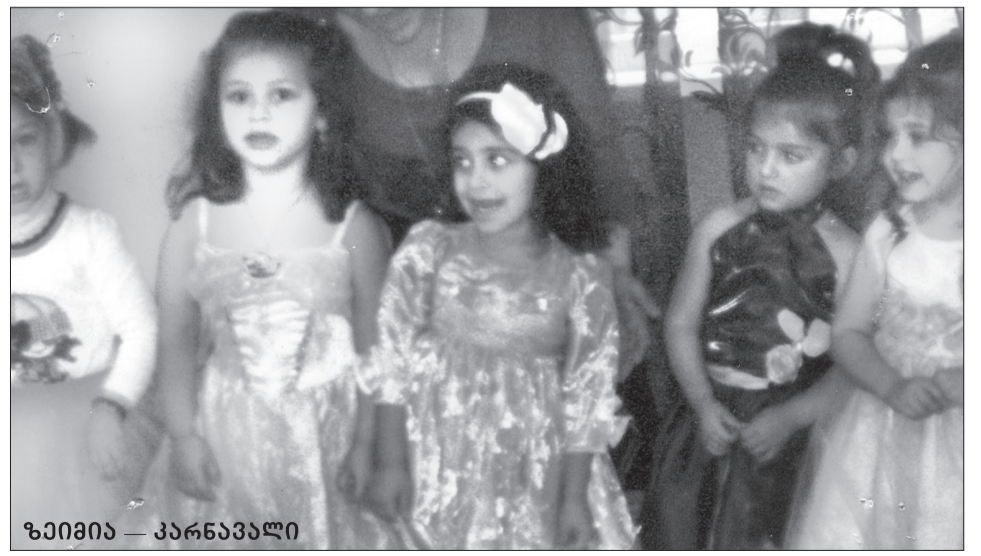
ზაიშია — კარნავალი

როგორც ზემოთ გაკვრით ვთქვი მშობლები ძალიან კმაყოფილი და გახარებული არიან ბაგა-ბაღის კეთილმომსახურებით. ამიტომ მოილტვიან და მოუხარიათ აქეთკენ ცეროდენებს. „სიყვარული – სიყ-