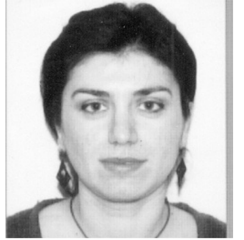
უღეთიან, ამბობდნენ. ჩემი პალმა გამახსენდა

...მალე დადიდა და იატაკზე დავიძინეთ. გამოენისას, არც თუ შორს პატარა ქალაქი გამოჩნდა. მახსოვს, ხალხი გახარებული ულოცავდა ერთმანეთს გადარჩენას, ქობ-