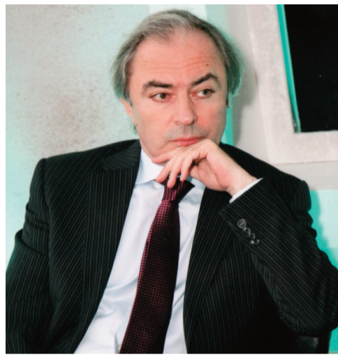
გაზეთ «სამართლმლო და სოფლიოს» ესაუბრება