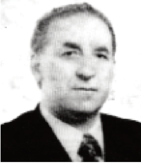
დასაწყისი "ილორი" №171-237

ინდოეთის ქალაქ ჰაიდარაბადში გამართულ პროფესორ სიმონი უმზე განხილულ იქნა ქალაქ მოქმედობის იდეოლოგიით მოცული ბედი, - ქალაქი მასობრივი მოსახლეობის იარაღის გამოყენების შედეგად განადგურებულად მიანისა.