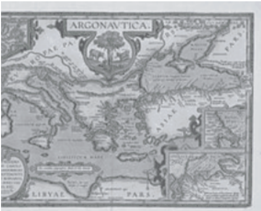
არგონავტების მოგზაურობის რუკა (აბრაჰამ ორტილიუსი 1624 წ.)

ოქრომენოსის მეფის ათამანტის ძესა და ასულს-ფრიქსუსსა და პელეს-დედინაცვლის ვერაგობისაგან დასახსნულად დედამ, ქალღმერთ-