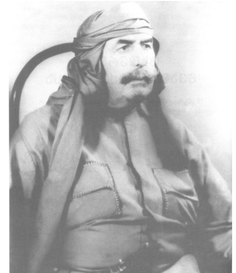
(გაგრძელება შემდეგ ნომერში)