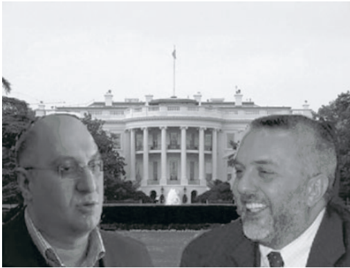
(ნახევრადსერიოზული ირონიით ნათქვამი: მკვდარი მკვდარს აკეიდაო...)

არსებობს ძველებური ქართული თქმა: სხვა დამხმარე რომ ვერაინ ნახა, მკვდარი თურმე სხვა მკვდარს აკეიდა, იქნება როგორმე საფლავამდე მიმიყვანო, დანარჩენი კი მე ვიციო. დაახლოებით ასეთი სურათი გამოიხატა ქართულ პოლიტიკურ სექტორში, მას შემდეგ, რაც საქართველოს ცენტრალური საარჩევნო კომისიის თავმჯდომარე ზურაბ ხარატიშვილმა ზედ არჩევნების წინ დასტოვა პოსტი და ახალი პოლიტიკური ძალის შექმნა დააანონსა. თუმცა, ისიც მალე გაირკვა, რომ ჩვენი "ზედნიერება" ამით არ ამოწურულა და, ამავდროულად, შესაძლებელია ზურაბ ხარატიშვილმა საქართველოს პრეზიდენტის პოსტზეც იყაროს კენჭი!