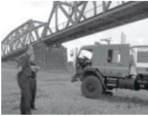
სახანძრო დაცვისა და სამაშველო სამსახურს ახალი სახანძრო მანქანა გადაეცა

ხობის მუნიციპალიტეტის გამგეობის სახანძრო დაცვისა და სამაშველო სამსახურის საქმიანობის ეფექტურობის გაზრდისათვის შეძენილ იქნა სპეცტექნიკა – სატრანსპორტო საშუალება (სახანძრო ავტომანქანა KAMA3-AC8).