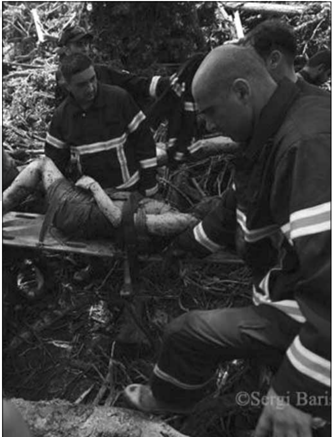
განსაკუთრებული ყურადღება საჭირო, რადგან ინფექციებს ემატება პნევმონიის, რევმატიზმისა და გაციების ალბათობა. პირველ რიგში, მოსახლეობა ხარისხიანი სასმელი წყლით უნდა უზრუნველყონ, გარდა ამისა, საერთაშორისო ნორმების მიხედვით, სამედიცინო ბრიგადები ყოველდღიურად უნდა ამონიმდეს სტიქიის ადგილს და იქ მობილიზებული ადამიანების ჯანმრთელობის მდგომარეობის მონიტორინგს უწყვეტ რეჟიმში აწარმოებდნენ; გასატარებელია სადეზინფექციო პროფილაქტიკური სამუშაოები და ასეთი მობილიზაცია წყლის დონის დანევიდან 30-45 დღე-ღამის განმავლობაში უნდა იყოს გამოცხადებული (!!).

ინფექციები და მათი მასშტაბი უსერიოზულესი პრობლემაა. მთავარი გამოწვევა — მწყობრიდან გამოსული წყალმომარაგების სისტემა და სასმელი წყლის დეფიციტი. სწორედ ეს ხდება მიზეზი ნაწილობრივ ინფექციების სწრაფად გავრცელებისა — ნაგვით სავსე კონტეინერები, ფეკალიები, ნიადაგის ნაშალი, ცხოველთა გვამები, დაღუპულთა ცხედრები საუკეთესო გარემოა მავნე ბაქტერიების გასამრავლებლად, ხოლო თბილი წყალი და ჰაერის მაღალი ტემპერატურა საფრთხეს აორმაგებს. რალაც წყალში ილექება, რალაც ორთქლდება, რალაც კი ხმელეთზე აღმოჩნდება და არ ღირს ახლა მიაშიტურად ფიქრი, რომ ინფექციები მხოლოდ წყლით ვრცელდება, ადამიანები, ცხოველები (თაგვი, ვირთხა, ყვავი), მწერები (ბუზი), ხელს უწყობენ მათ სწრაფ გავრცელებას. დაინფიცირება კი შემდეგი გზებით ხდება: დაუმუშავებელი წყლის მიღებისას, ჭურჭლის რეცხვისას, საკვების მიღებისას (პროდუქტი შეიძლება დაავადდეს კულინარიული დამუშავების ან შენახვისას), ჭუჭყიანი ხელით კონტაქტისას... ალბათ სწორედ ამით იყო განპირობებული დაავადებათა კონტროლის ეროვნული ცენტრის რეკომენდაციები, როცა მოსახლეობას მოუწოდებდნენ, ხშირად დაეხმებინათ ხელი, დაეღობინათ მხოლოდ გადაადრეული წყალი, ჭურჭლის რეცხვისას კი მათეთრებელი გამოეყენებინათ, მაგრამ რეალურად, ეს რეკომენდაციები პრევენციად ვერ გამოდგებოდა და ახლავს აგისხნით, რატომ? — სტატისტიკურად დადასტურებულია, რომ სტიქიის შემდეგ მკვეთრად იმატებს მოსახლეობის ავადობის მაჩვენებელი. ასეთ დროს