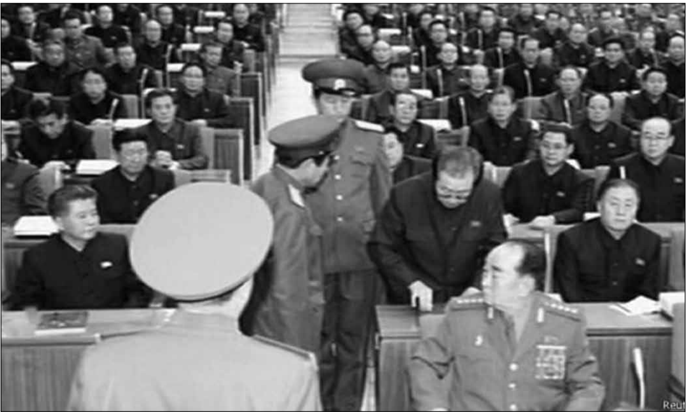
ჩრდილოეთ კორეის ლიდერის ბიძა ჩან სონ თხენი, 2013 წელს, შრომის პარტიის პოლიტიბიუროს სხდომაზე დააპატიმრეს

ისე, ჩრდილოეთ კორეის თავდაცვის მინისტრი, პრეზიდენტის შეურაცხყოფის ბრალდებით გამოასაღმეს სიცოცხლეს და არც ჩვენი თუ სხვისი პრეზიდენტების შეურაცხყოფაა ქართველი ლიდერებისთვის „უცხო ხილი“. სერიოზული ბრალდებები და გახმაურებული საქმეები სტატიის ყანრის გამო არ გავიხსენეთ. თანაც, იმის ხაზგასმამ გვინდოდა, რომ სასჯელად, საქართველოს კიმ ჩენ ინის მსგავსი მმართველი რომ ჰყავდეს. ჰოდა, მადლობა შენიწორო ამ ქვეყნის ძლიერებმა უფალს, რომ საქართველო კორეა არ არის და ამ მიმართულებით მაინც ითვლება ჩვენი ქვეყანა ცივილიზაციისა თუ დემოკრატიის შუქურად.