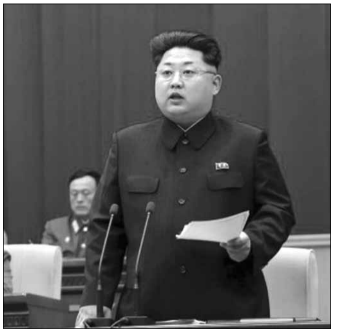
გავრცელებული ინფორმაციით, მიმდინარე წლის დასაწყისში, კორეის ლიდერის კიმ ჩენ ინის ბრძანებით, 15 ჩრდილოკორეული მალაჩინოსანი დახვრიტეს

თლებია, ჩვენი ლიდერები თავს დაუცველად არ გრძნობენ თუ პრეზიდენტები არ გვეყოლია ისეთები, გურიაში რომ ამბობენ, არაა მი მთლად დალაგებული. „მთლად დალაგებული“ და თანამდებობისთვის შესაფერისი, არც თავდაცვის მინისტრები გვეყოლია და თითო ისეთი სკანდალი, კორეულ რეალობაში ქვემეხების სამიზნედ რომ აქცევა, ყველას აქვს. ამ მხრივ რეკორდი, მგონი ახალგაზრდათა თავდაცვის მინისტრებულმა თინათინ ხიდაშელმა მოხსნა — დანიშნული არ იყო, კრიტიკის ისეთ ქარცეცხლში გაეხვია, ღმერთს მადლობა, კორეული კანონები არ კანონობს ჩვენთან, თორემ ნახავდა ჯარისკაცის „ბუშლატა-მოსხმულს“ „ქართველი კიმ ჩენ ინი“ და გასცემდა ბრძანებას — რასაა რომ კადრულობს ეს ქალი, როგორ შეურაცხყოფს მეტრძოლის სამოსელსო. სამოსელს ვინ ჩივის, თავდაცვის ქალბატონ მინისტრს თავად ქართული არმიის შეურაცხყოფისთვისაც დაუმიზნებდნენ ალბათ საარტილერიო იარაღს — ჯართან დაცვით მივიდა, თანაც დაცვა ჯარისკაცებსა და