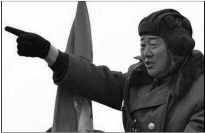
ხიონ იონ ჩხოლი თავდაცვის მინისტრად 2014 წელს დანიშნა

ჩვენ დედასაქართველოს ხან რომელ ქვეყანას ადარებენ, ხან რომელს. ხან სინგაპურიზაციის გზას გვიყენებენ და ხანაც დუბაიზაციის. კიდევ კარგი, ჩრდილოეთ კორეა არავის გახსენებია აქამდე, თორემ... საქართველო რომ კორეა იყოს, „საზარბაზნე ხორცად“ რამდენს ვიხილავდით, წარმოდგენა არც ისე რთულია. მე შენ გეტყვი, ფიცხი ხასიათი არ გვაქვს, ვირზე უკულმა არ შეგვისვამს ხალხი, ლინჩის წესით არ გაგვისამარ-