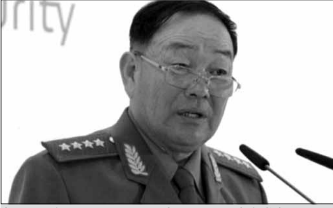
სეული: ჩრდილოეთ კორეის თავდაცვის მინისტრი იმის გამო დახვრიტეს, რომ ჩაეძინა სამხედრო ღონისძიებაზე, რომელსაც კიმ ჩენ ინი ესწრებოდა.