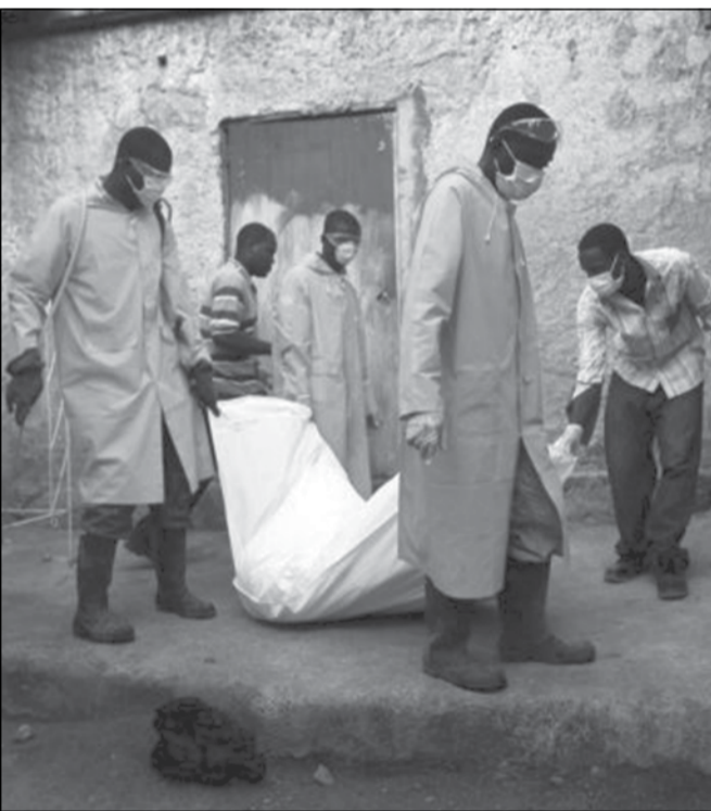
აგენტის მატარებლები, არსებულ ვითარებაში კი შეუძლებელია გარკვევა, რა ვირუსები და ბაქტერიები კატასტროფის ზონაში;

ნეპალში მომხდარმა მინისტრამ მსოფლიო შეძრა. ათასობით დაღუპული და ათიათასობით დაზარალებული, ასეთია საგანგაშო სტატისტიკა, მაგრამ მსოფლიო მეცნიერები საფრთხეს გადავლილად არ მიიჩნევენ და შიშობენ, რომ მსოფლიოს ინფექციების ახალი ტალღა გადაუვლის, რასაც ნეპალში არსებული ანტისანიტარია და წყლის მინოდების დაზიანებული სისტემები განაპირობებს.