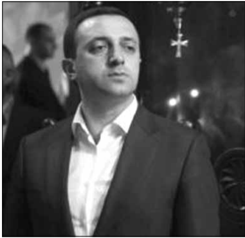
მთავრობის მეთაურის თქმით, „ჩვენი ერი აუცილებლად მიხვდება, თუ რაოდენ დიდია უწმინდესის ღვაწლი ქრისტიანობის განმტკიცების საქმეში“.

საქართველოს პრემიერ-მინისტრმა, ირაკლი ლარიბაშვილმა სვეტიცხოვლის საკათედრო ტაძარში პატრიარქს, მთავრობისა და მხედრობის სახელით, აღსაყდრებიდან 37 წლის იუბილე მიულოცა.