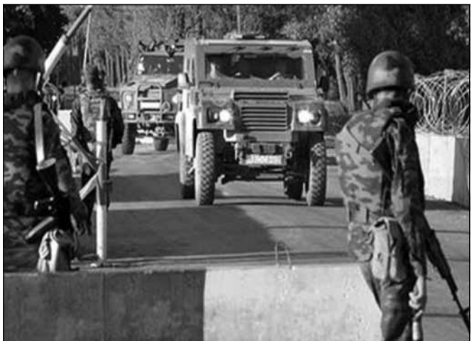
რუსეთსა და ე.წ. სამხრეთ ოსეთს შორის შეთანხმების გაფორმება 2015 წლის იანვრისთვის იგეგმება.