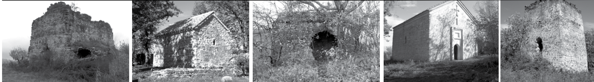
ვაჩნაძიანი: „ნადარბაზვი“, „ყვავის საყდარი“, „გომართის ღვთისმშობელი“, „მამამაური“, გოჯიაურების „ღვთისმშობელი“ და ერთ-ერთი კომპი