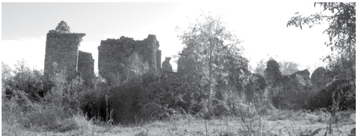
ვაჩნაძიანის „პალატები“: კარის ეკლესია „წმ.მარინე“ და სასახლის ნაშთები

მაგრამ გიორგი მეფე იმავე წელს გარდაიცვალა და საქართველო რუსეთმა შეიერთა. საფიქრებელია, რომ კალაურის ორად გაყოფა სოფლისა და ჯანდიერების დაპირისპირების გაგრძელების შედეგია. ჯანდიერებს ვაჩნაძეებისგან ნაყიდი მკვიდრი მამული — კალაურისხევის მარცხენა სანაპიროს ძველთაძველი სასახლეები, ციხე-კომპლექსი და ეკლესიების დიდი ნაწილი დარჩათ. მთელი ამ ისტორიის გადმოცემა იმისთვის დამჭირდა, რომ ჩემს შემდეგ კალაურ-ვაჩნაძიანში ჩასული კაცი რამდენადმე შემზადებული მაინც დაუხვდეს კალაურელთა გაუთავებელ დავას მიწებისა და საყდრების კუთვნილებაზე, რომლებიც საერთო სახელმწიფო, ეროვნული საკუთრებაა.