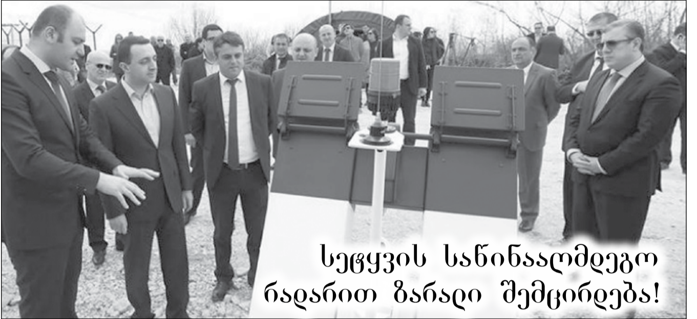
სეცვის სანინალმდეგო რადართ ბარადი შემცირება!

საქართველოს პრემიერ-მინისტრის, ირაკლი ლარიბაშვილის ინიციატივით, დაიწყო პროექტი „ძლიერი რეგიონი — ძლიერი საქართველოსთვის“. პროექტის ფარგლებში, პრემიერ-მინისტრმა უკვე მეხუთე შეხვედრა გამართა. 15 აპრილს, ირაკლი ლარიბაშვილი კახეთის რეგიონს ესტუმრა. „ძლიერი რეგიონი — ძლიერი საქართველოსთვის“, საქართველოს რეგიონების სტრატეგიულ და ეკონომიკურ განვითარებას გულისხმობს. მთავრობის ხელშეწყობით, პროექტი შეჩერებული და მიტოვებული სანარმოების აღდგენა-ამუშავებას, ასევე რეგიონების მოსახლეობის დასაქმებას შეუწყობს ხელს.