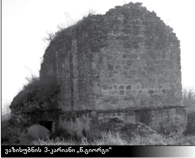
ვაზისუბნის 3-კარიანი „წ. გიორგი“

ზისუბანი შემოგარენში სხვადასხვა ეპოქის 21 ეკლესია დგას. ბუნებრივია, ყველას გადაღებას ვერ მოვახერხებდით და ამიტომ მხოლოდ გამორჩეული ძეგლები შემოვიარეთ. თავდაპირველად, ადრეშუასაუკუნეების ტაძრებს ვეწვიეთ. ერთი მათგანი — სამეკლესიანი „წმინდა გიორგი“, რომელსაც გვერდითი ეკლესიები თითქმის აღარ შემორჩენია, სამკარიანი ეკლესიის სახელითაა ცნობილი. VI-ის ეს ტაძარი სოფლის ჩრდილო-აღმოსავლეთი უბანში დგას და ნაგებია სხვადასხვა ზომის (შიგნით მომცრო, გარეთ მოზრდილი) რიყის ქვით. წყობის თარაზულობის დასაცავად ცალკეულ მონაკვეთებში საფანჯარულ ნვრილი კლდის ნატეხებია ჩაყოლებული. გადარჩენილი ცენტრალური ეკლესიის სიგრძე 12,5 მეტრია, ხოლო სიგანე ამ ეპოქის ეკლესიებისთვის მოულოდნელად დიდია — 6 მეტრი. მიუხედავად ამისა, ტაძარი მაინც სიმაღლეზეა ორიენტირებული. ნაგებობაში ადრე შუასაუკუნეებისათვის დამახასიათებელ კონსტრუქციულ ფორმებს ვხვდებით: არქიტრავული შესასვლელი ოდნავ შემადგენელი საკურთხევლის იატაკი, კონქის, თაღებისა და სარკმლების ნალისებრი შემონერძობა, სუსტი განათება... როგორც უკვე ითქვა, სამეკლესიანი ტაძრიდან, ასე თუ ისე, ცენტრალური ეკლესიაა გადარჩენილი. სამხრეთის ეკლესია და დასავლეთის გარშემოსავლელი სრულიად მოშლილია, ხოლო ჩრდილოეთ ეკლესიიდან მხოლოდ მისი აღმოსავლეთ ნაწილის — სამკვეთლოს კედლები დგას.