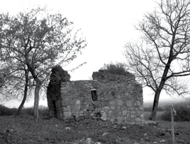
ვაზისუბნის „წმ. გიორგი“ და „ნათლისმცემელი“