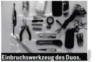
Einbruchswerkzeug des Duos. 2013 fast 50 Einbrüche im Großraum Wien verübt. Der angerichtete Schaden und die Beute belaufen sich auf 400.000 Euro. Weitere Einbrüche durch das Duo sind nicht ausgeschlossen.

Zwei gefasste Einbrecher haben bei 50 Straftaten 400.000 Euro Schaden angerichtet. Wien. Die beiden Berufsverbrecher aus Georgien (32 und 46) wurden bei einem ihrer Coups in Wien-Penzing auf frischer Tat ertappt und von der Polizei festgenommen. Im Zuge der Einvernahmen durch Beamte des LKA-West legte der Jüngere der beiden schließlich ein umfassendes Geständnis ab. Demnach haben die beiden Profis seit