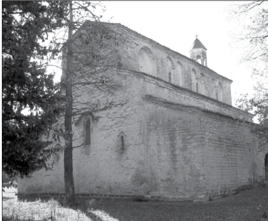
ვაზისუბნის „ღვთისმშობელი“: ჩრდილო-აღმოსავლეთიდან და სამხრეთიდან, გარშემოსავლელი შიგნიდან