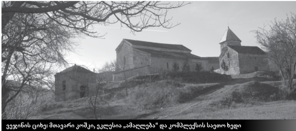
ვეჯინის ციხე: მთავარი კოშკი, ეკლესია „ამალღება“ და კომპლექსის საეთო ხედი

ჩუქურთმა, რომლითაც (მარტივი, ორმაგი ლილვები) სარკმლები და გუმბათის ყელი მოურთავს.