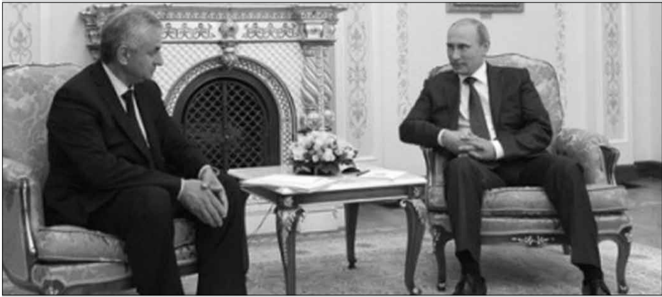
რას საფრთხეს შეუქმნის საქართველოს რუსეთ-აფხაზეთის შეთანხმება