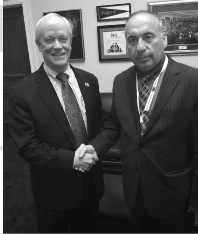
ამერიკულს და, საერთოდ, მსოფლიო მოთხოვნებს აკმაყოფილებს?

ასეთ ფონზე, ცოტა გაუგებარია, რატომ მიიღო „სუბელიანის კანონპროექტმა“ პირველი მოსმენისას ხმათა უმრავლესობა. გიორგი ვოლსკი ამას კომუნიკაციის ნაკლებობით ხსნის. მისი თქმით, ბოლო პერიოდში, დეპუტატებმა დეტალურად განიხილეს ამ საკითხის ყველა დეტალი, უარყოფითი თუ დადებითი მხარე, რაც მისი აზრით, იმის საფუძველი გახდება, რომ საბოლოოდ, უმრავლესობა, სწორედ იმ პოზიციას იქნება, რომელიც თავად აქვს. ასე რომ, თუ ვოლსკის პროგნოზი გამართლდა, პარლამენტი „სუბელიანის კანონპროექტს“ მხარს არ დაუჭერს.