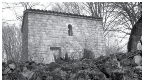
ჭერემის „წმინდა ბარბარე“; ჭერემის წვეროდაბალის „წმინდა თევდორე“; ჭერემის „მამა დავითი“