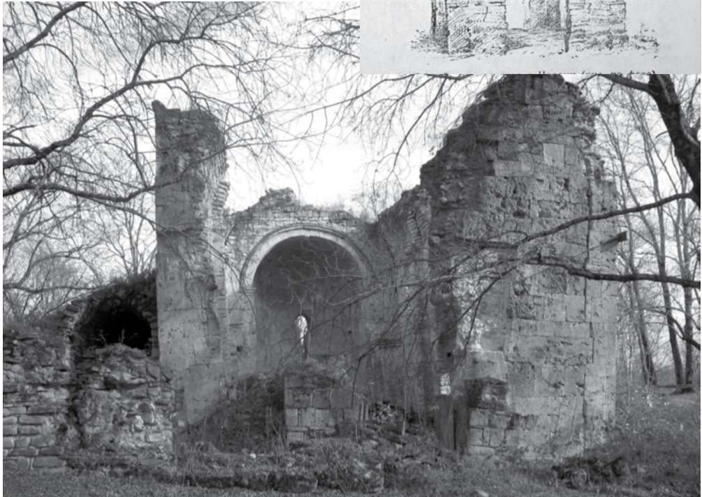
IV ს-ის „კვადრატის“ შემორჩენილი ესკიზი; ჭერემის საეპარქიო ტაძრისა და ეპისკოპოსის სასახლის ნაშთები

გორგასლის აგებული ციხე-ქალაქის გალავანი წვეროდაბალის „წმ. თევდორეს“ ეკლესიამდე გრძელდება ფრაგმენტულად. V-VI საუკუნეთა მიჯნის ეს საყდარი, გიორგი ჩუბინაშვილის აზრით, სამეკლესიანი ყოფილა, მაგრამ ახლა სამხრეთისა და ჩრდილოეთის ეკლესიებისა მხოლოდ კვალი ჩანს. სხვა მკვლევარები, აქ ჩატარებული ბოლო-დროინდელი კვლევების საფუძველზე, ნაგებობას სამკვეთლოიან და გარშემოსაველიან დარბაზულ ტაძრად მიიჩნევენ. ასეა თუ ისე, ფაქტია, რომ საყდარი საგულდაგულოდ თლილი შირიმის კვადრებით აუგიათ და ადგილიც დომინანტური მურჩევიან. სარესტავრაციო სამუშაოების დროს კონქის შუბლში აღმოჩნდა X საუკუნის მინურულის ნარჩენიანი კრამიტი, რაც იმას ადასტურებს, რომ ეკლესია ამ პერიოდში საფუძვლიანად შეუ-