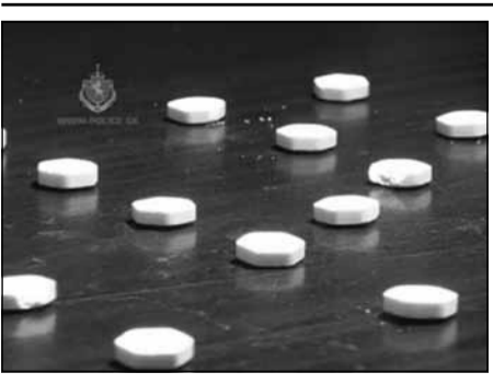
დინარეობს (საქართველოს სსკ-ს 260-ე მუხლის მე-3 ნაწილის „ა“ ქვეპუნქტით).

გამოძიება განსაკუთრებით დიდი ოდენობით ნარკოტიკული საშუალების უკანონო შექმნა-შენახვისა და საქართველოში უკანონოდ შემოტანის ფაქტზე მიმდინარეობს (საქართველოს სსკ-ს 260-ე მუხლის მე-3 ნაწილის „ა“ ქვეპუნქტით და 262-ე მუხლის მე-4 ნაწილის „ა“ ქვეპუნქტით).