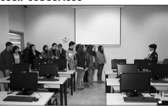
სკოლის მოსწავლეები ესტუმრნენ.

მსგავსი ღონისძიებები შსს-ს აკადემიაში პერმანენტულად ტარდება და მათი მიზანია ახალგაზრდებში სამართლებრივი კულტურის ამაღლება და ამ გზით დანაშაულის პრევენცია.