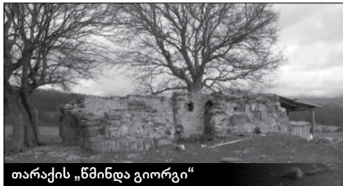
თარაქის „წმინდა გიორგი“

— აბა, სხვა მეორე გზა რომელია?! — უკვირს ჩემს მეგზურს.