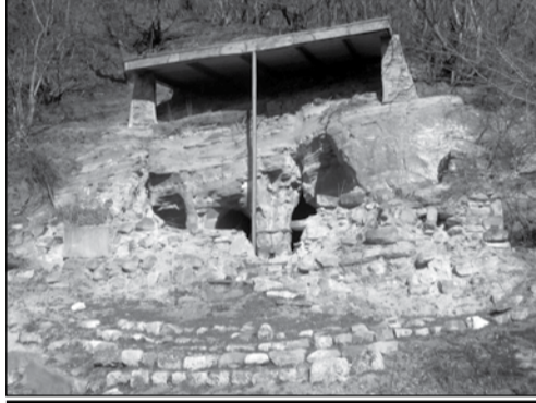
ბურდიანის ეკლესია და სტელის ფრაგმენტი