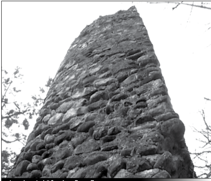
„ქალის ციხის“ ზურგიანი კოშკი

მანავის ციხის ეზოში შევიდვართ. თვალი ნელ-ნელა განარჩევს ორ სამშენებლო ფენას — განვითარებულისა და გვიანი შუასაუკუნეებისას. ციტადელისთვის საძირკველი, მართლაც, ჭიაბერის დროს, XII-XIII საუკუნეებში ჩაუყრიათ იმ ერთი, მცირე ეკლესიის გარშემო, რომელიც ახლა კომპლექსის შუაგულშია. მანავის ციხე ორჯერ საშინლად დაარბიეს — ერთხელ თემურ-ლენგმა და მეორედ — შაჰ-აბასმა — საქართველოს ორმა მანიაკალურმა მტერმა. ერთხელ იგი კახთა სახელგანთქმევემ, ლევანმა აღადგინა, მეორედ დავით II-იმამ-ყული ხანმა. 1722 წელს აქ ქორნილი გადაუხდია თემურაზ II-ს. საერთოდ, XVII საუკუნეში მანავი ერთხანს კახეთის ცენტრიც კი გახდა, რადგან, ლევთა ვახშირე-ბული თავდასხმების გამო, იმამ-ყული ხანს ყარაღაჯი არ დაედგომებოდა და რეზიდენცია აქ გადმოიტანა.