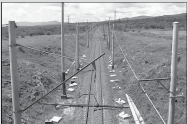
ბაქო-ჯეიჰანის საკინიგზო მაგისტრალის ბაქო-ჯეიჰანის ორი დაჯგუფება დააკავეს

— „ოცნება“ ამდენი წელი საარჩევნო სისტემას აკრიტიკებდა, ბოლო ორ არჩევნებზე კი კარგად მოიგო და შეიგო. სამუშაო საკმაოდ დიდია. ჯერ არასაპარლამენტო ოპოზიციის ბირთვი უნდა ჩამოყალიბდეს და მერე დაიწყოს საუბარი საზოგადოებასთან, არასამთავრობო სექტორთან, მედიასთან, უცხოურ ორგანიზაციებთან... ეს ისეთი საკითხებია, რაზეც ლიად წინააღმდეგი არავინ ნავა. დაახლოებით, ერთ თვეში, არასაპარლამენტო ოპოზიციის პოზიციებს შეაჯერებს. აქ არაა საუბარი საარჩევნო ან პოლიტიკურ გაერთიანებებზე. ვერც იმას გეტყვით, ქუჩაში გამოვალ და ვირბენ-მეთქი — აქციები ის მეთოდი არაა, რითიც მსგავსი საკითხები უნდა გადაწყდეს. ასე რომ, ჯერ ჩამოყალიბდებით და ამის მერე პირველი, ვისთანაც კონსულტაციები დაიწყება, სწორედ ხელისუფლება და საპარლამენტო ოპოზიცია იქნება. დაველაპარაკებთ „ოცნებასაც“, ნაციონალებსაც და ვეცდებით, 2015 წლის შემოდგომისთვის ცვლილებები უკვე მიღებული იყოს.