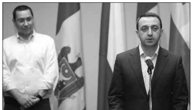
ასოცირებას მოეწერება ხელი, რაც ძალიან მნიშვნელოვანია. საქართველოს, უკრაინასა და მოლდოვას ევროკავშირისკენ გეზი უჭირავთ და ამ ქვეყნებში მაქსიმალურად დემოკრატიული რეფორმები ტარდება. ყოველთვის მხარს დავუჭერთ ამ ქვეყნებს. უმნიშვნელოვანეს ეტაპზე გადადიან უკრაინა, საქართველო და მოლდოვა და უფრო უახლოვდებიან ევროკავშირს“, — განაცხადა ვიქტორ პონტამ. „ინტერპრესნიუსი“

„მიხარია, რომ აქ ვმასპინძლობ პრემიერ-მინისტრებს და ვუზიარებ ჩვენს გამოცდილებას. მალე ევროკავშირთან