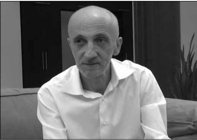
სასამართლოს თავმჯდომარის კანდიდატურის დამტკიცე-ბა-არდამტკიცება გახდეს?

— ვადაძელი არჩევნების მიზეზი, შესაძლოა, უზენაესი