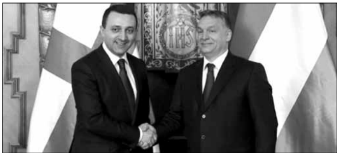
საქართველოს პრემიერ-მინისტრის უზენაესი მოადგილე ირაკლი ლარიბაშვილი

უნგრეთის მთავრობის მეთაური ქართველ კოლეგას მარშითა და საპატიო ყარაულის თანხლებით დახვდა. დახვედრის ოფიციალურ ცერემონიაზე შესრულდა საქართველოსა და უნგრეთის სახელმწიფო ჰიმნები. პირისპირ გამართულ შეხვედრაზე მხარეებმა ორი ქვეყნის ურთიერთობის ძირითადი საკითხები განიხილეს. განსაკუთრებული ყურადღება გამახვილდა ეკონომიკური და სავაჭრო თანამშრომლობის გაღრმავების მნიშვნელობაზე. საუბარი შეეხო საქართველოს ევროკავშირთან ინტეგრაციის და ნატო-ში გაწევრიანების თემებს. აღინიშნა ამ მიმართულებით მიღწეული პროგრესი.