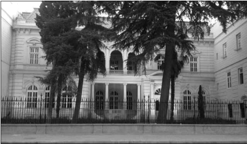
ყვებოდა, რომ 4 წლის განმავლობაში მშენებლობაზე 40 მლნ დოლარი დაიხარჯა.

ავლაბრის რეზიდენციის ხარჯებზე დოკუმენტაცია არც ფინანსთა და ეკონომიკის სამინისტროში იძებნება. ერთადერთი, ცნობილია, რომ მხოლოდ შენობის მოწყობისთვის (განათება და ა.შ.) თითქმის 600 ათასი ლარია დახარჯული. რადგან ავლაბრის რეზიდენციის მშენებლობის ხარჯი ოფიციალურად არ გამოქვეყნებულა, ამ ეტაპზე, მედიისთვის ხელმისაწვდომია მხოლოდ ის ინფორმაცია, რომელიც რამდენიმე წლის წინ ასევე სხვადასხვა მედიასაშუალებებმა გაავრცელეს. ერთ-ერთ გავრცელებულ ინფორმაციაში, რომ ხარჯებმა 800 მლნ დოლარს გადააჭარბა. ნაციონალური მოძრაობის მიმართ ლოიალურად განწყობილი ტელეკომპანია კი იუნ-