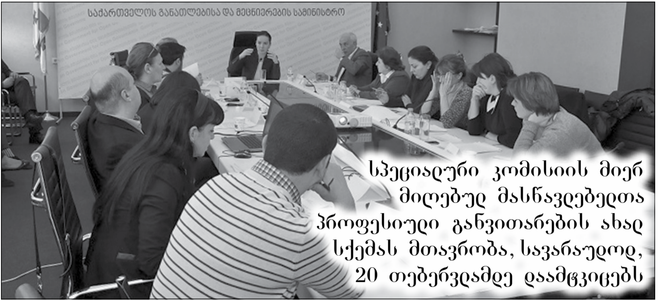
სპეციალური კომისიის მიერ მიღებულ მასწავლებელთა პროფესიული განვითარების ახალ სქემას მთავრობა, სავარაუდოდ, 20 თებერვლამდე დაამტკიცებს