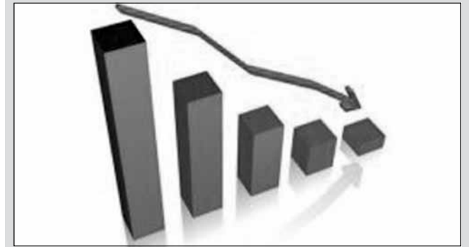
მთავრობა 4%-იან ეკონომიკური ზრდას ელის

ზემო აჭარა, ასევე მთიანი რეგიონები... „ენერჯეტიკის“ პირველი მტერი ქარია. დიდი პრობლემაა გზებიც. დიდთოვლობას დაზიანების ადგილამდე ფიზიკურად ვერ ვალწევთ. ერთხელ, მეტეოლოგი ათი ათასი აბონენტი გაითიშა და ჩვენმა ბრიგადებმა ფეხით სამი საათი იარეს. მინდა, ამ დროს მათთან ერთად ვიყო. რთულია ჩვენი ქსელის ოპერირება, მაგრამ ენერჯეტიკის სამინისტრო და კომპანიები წარმატებით ართმევენ თავს. ვისაც სურს, დამეთანხმოს და ვინც ასე არ ფიქრობს, ნუ დამეთანხმება. ეს ჩემი პირადი პოზიციაა.