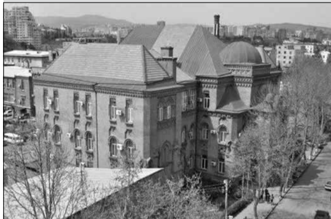
მთავრობა სტუდენტებს სარეზერვო ფონდიდან 27 725 ლარით დააფინანსებს

7 თონიკურად ყარაჩაელი, ჩეჩენი და ჩერქეზი სტუდენტის სწავლის დასაფინანსებლად, საქართველოს მთავრობის სარეზერვო ფონდიდან 27 725 ლარი გამოიყოფა. საქართველოს განათლებისა და მეცნიერების სამინისტროს ინფორმაციით, თბილისის სახელმწიფო უნივერსიტეტის ჰუმანიტარულ მეცნიერებთა ფაკულტეტის კავკასიოლოგიის მიმართულებაზე, ბაკალავრიატის საფეხურზე ამ ეტაპზე 7 სტუდენტი ირიცხება. საქართველოს განათლებისა და მეცნიერების სამინისტროს დახმარებით, 7 თონიკურად ყარაჩაელი, ჩეჩენი და ჩერქეზი სტუდენტის სწავლის საფასური მთავრობის სარეზერვო ფონდიდან დაიფარება: „კავკასიოლოგიის ფაკულტეტის რეგიონში მხოლოდ საქართველოში არსებობს. შესაბამისად, ჩრდილოკავკასიულ ხალხთან მრავალწლიანი კეთილმეზობლური ურთიერთობებიდან გამომდინარე, რეგიონის ახალგაზრდები განათლებას სწორედ საქართველოში იღებენ. სტუდენტთა დაფინანსებას ორი წლის განმავლობაში „კავკასიის ფონდი“ უზრუნველყოფდა, რომელმაც ფუნქციონირება 2013 წელს შეწყვიტა. სტუდენტები ერთი სემესტრის განმავლობაში ფონდმა „ქართუმ“ დააფინანსა. გამომდინარე იქიდან, რომ ასეთი სახის ხარჯების დაფარვას საქართველოს განათლებისა და მეცნიერების სამინისტროს არც ერთი პროგრამა არ ითვალისწინებს, სამინისტრომ დააყენა აღნიშნულ სტუდენტთა მთავრობის სარეზერვო ფონდიდან დაფინანსების საკითხი, რაც დადებითად გადაწყდა“.