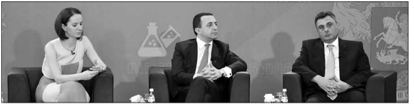
განათლების სამინისტრომ ტექნიკური უნივერსიტეტის აგრარული ფაკულტეტის შენობა გაარემონტა და უნიკალური დაბორიანებით აღჭურვა

განათლება და სოფლის მეურნეობის განვითარება საქართველოს ხელისუფლებამ პრიორიტეტად გამოაცხადა. ამ ფონზე, გასაკვირი არ არის, რომ განათლების სამინისტროს მხარდაჭერით, ტექნიკური უნივერსიტეტის ახლადშექმნილი — აგრარული მეცნიერებებისა და ბიოსისტემის ინჟინერინგის ფაკულტეტი შექმნილიდან გურამიშვილის გამაზირზე, ახალგაზრდობის შენობაში გადავა. აქ კი, თანამედროვე ინფრასტრუქტურასთან ერთად, სტუდენტებს, სახელმწიფო ბიუჯეტიდან გამოყოფილი თანხებით შექმნილი უნიკალური ლაბორატორიაც დახვდებათ. ფაკულტეტის დეკანის აზრით, სახელმწიფოს მხარდაჭერა სასწავლებლისთვის მნიშვნელოვანია, ინვესტიციის განათლებაში ჩადება კი, საუკეთესო საქმე, რომელიც ქვეყანას, ბუმერანგით დაუბრუნდება. ტექნიკური უნივერსიტეტის რექტორის, არჩილ ფრანგიშვილის განმარტებით კი, სასწავლებლის ხელმძღვანელობა სტუდენტებს, ხარისხიანი განათლების მისაღებად ყველა პირობას შეუქმნის.