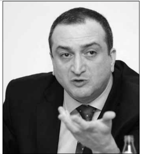
2014 წლის მთავარი ეკონომიკური შედეგა და 2015 წლის პროგნოზი

ფაქტორად რთულ პოლიტიკურ კლიმატსა და მუდმივად დაძაბული ფონის შექმნასაც მიიჩნევს. გასული წლებისგან განსხვავებით, როცა ოპოზიცია ძლიერი იყო და პოლიტიკურ დაძაბულობას სწორედ ხელისუფლების ოპონენტები ქმნიდნენ, ახლა სიტუაცია შეიცვალა. ექსპერტი აცხადებს, რომ „ქართულ ოცნებას“ ძლიერი ოპონენტები არ ჰყავს და პოლიტიკურ დაძაბულობას ხელისუფლება ქმნის, რასაც მისი საგარეო ავტორიტეტი მინიმუმამდე დაჰყავს: