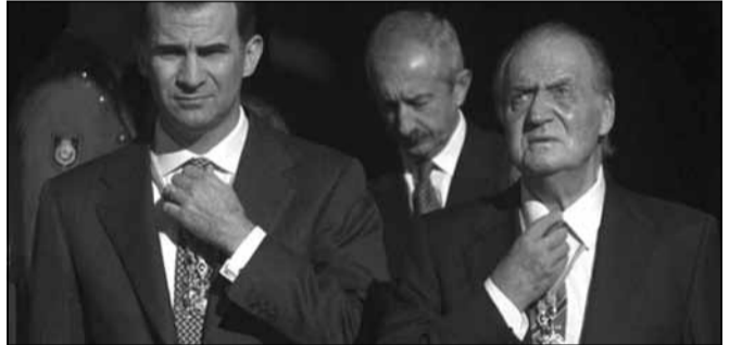
ესპანეთის მეფე ხუან კარლოსი ბახილან გაღაღა

ჩვენი ევროკავშირისკენ მივდივართ, ასოციაციის ხელშეწყობას ხელს ვანერო, მაგრამ თბილისში პროსპექტი არ დარჩენილა, სადაც სტიქიური გარეგავაჭრობა არ არის. დღეს გარეგავაჭრობის გაცილებით ფართო ქსელია, ვიდრე 3-4 წლის წინ იყო. „დელისზე“, სადაც ვცხოვრობ, ორი-სამი წლის წინ ასეთი მდგომარეობა არ იყო, დღეს მტვერსა და სიბინძურეში იყავდა ხილი, რძის ნანარმი... თბილისზე, როგორც ევროპულ ქალაქზე ლაპარაკი ზღაპარია. ჩვენი ხელისუფლების მთავარ პრობლემად კი ის იქცა, ვინ მოანერს ხელს ასოციაციის ხელშეწყობაზე.