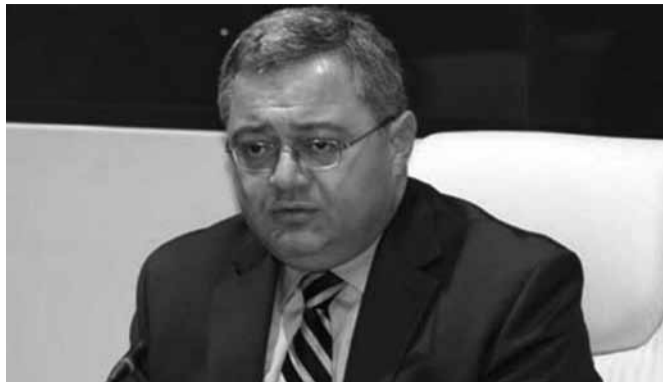
პარლამენტის ბიუჯეტი აღარ გაიზარდება

საქართველოს პარლამენტის თავმჯდომარის, დავით უსუფაშვილის ინფორმაციით, საქართველოს პარლამენტის მომავალი წლის ბიუჯეტი არ გაიზარდება. მისი თქმით, საზოგადოებაში ბიუჯეტის მომავალი წლის პარამეტრებმა გარკვეული ვენაბათაღელვა გამოიწვია, ამიტომ უმრავლესობის გადაწყვეტილებით, საკანონმდებლო ორგანოს ბიუჯეტი იგივე რჩება, რაც 2014 წელს არის: „უმრავლესობის პოზიცია ასეთია, რომ მომავალი წლის პარამეტრები დარჩეს იგივე და არ გაიზარდოს. რაც შეეხება გარკვეულ მუხლობრივ ცვლილებებს, ამ საკითხს შემდგომში დავუბრუნდებით, როცა პარლამენტი მუშაობას შეუდგება, ამიტომ პარლამენტის 2015 წლის ბიუჯეტის პარამეტრები 2014 წლის იდეტური იქნება.“ 16 მაისს, პარლამენტმა მიიღო დადგენილება საქართველოს პარლამენტის 2015 წლის ბიუჯეტის პროექტის დამტკიცების შესახებ, რომლის თანახმად პარლამენტის ბიუჯეტი მომავალი წლისთვის 54 695 000 ლარით განისაზღვრა, რაც წლევანდელთან შედარებით, 2 604 000 ლარზე მეტია. გაზრდილი თანხით პარლამენტმა შრომითი ანაზღაურების გაზრდა და ავტოპარკის განახლება დაგეგმა. „პირველი“