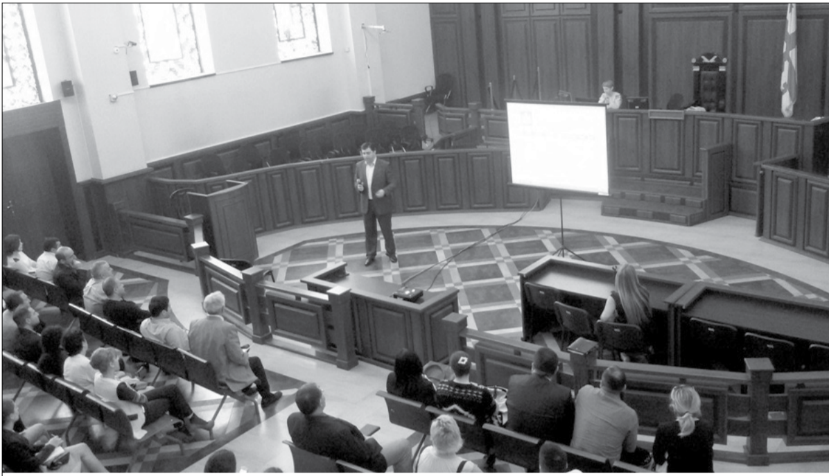
თბილისის საქალაქო სასამართლოს თავმჯდომარე მამუკა ასვლიანი ელექტრონული საქმისწარმოების პროგრამის პრეზენტაციაზე

ლავთ. ეს პროგრამა ევროპის ბევრ სახელმწიფოში ჯერ კიდევ 1990-იანი წლებიდან დაიწყო და თითქმის ყველა ქვეყნის მართლმსაჯულება ცდილობს ამ სისტემაზე გადასვლას. ექსპერტთა თქმით, ყოველწლიურად ამ პროგრამების შექმნისათვის 5 მილიარდ დოლარზე მეტი იხარჯება. თუმცა, იმის გამო რომ იგი საკმაოდ რთული შესაქმნელი და ასამოქმედებელია, ხშირად მისი დანერგვის მცდელობა უშედეგოდ სრულდება. თითოეული ასეთი პროგრამის შექმნელად და ასამუშავებლად დაახლოებით რვა-ათი წელია საჭირო.