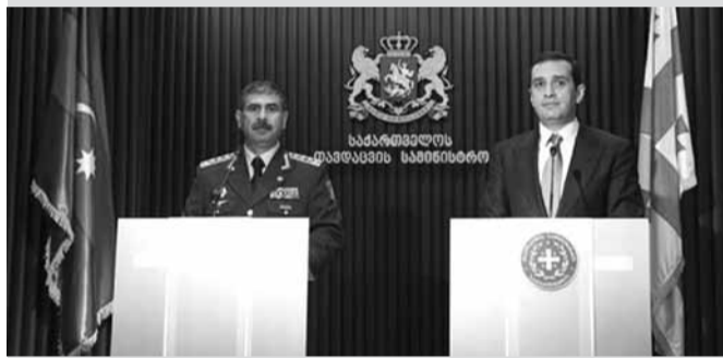
აზერბაიჯანი ქართულ სამხედრო ტექნიკას შეიძინებს

საქართველოს პარლამენტის თავმჯდომარის, დავით უსუფაშვილის ინფორმაციით, საქართველოს პარლამენტის მომავალი წლის ბიუჯეტი არ გაიზარდება. მისი თქმით, საზოგადოებაში ბიუჯეტის მომავალი წლის პარამეტრებმა გარკვეული ვენაბათაღელვა გამოიწვია, ამიტომ უმრავლესობის გადაწყვეტილებით, საკანონმდებლო ორგანოს ბიუჯეტი იგივე რჩება, რაც 2014 წელს არის: „უმრავლესობის პოზიცია ასეთია, რომ მომავალი წლის პარამეტრები დარჩეს იგივე და არ გაიზარდოს. რაც შეეხება გარკვეულ მუხლობრივ ცვლილებებს, ამ საკითხს შემდგომში დავუბრუნდებით, როცა პარლამენტი მუშაობას შეუდგება, ამიტომ პარლამენტის 2015 წლის ბიუჯეტის პარამეტრები 2014 წლის იდეტური იქნება.“ 16 მაისს, პარლამენტმა მიიღო დადგენილება საქართველოს პარლამენტის 2015 წლის ბიუჯეტის პროექტის დამტკიცების შესახებ, რომლის თანახმად პარლამენტის ბიუჯეტი მომავალი წლისთვის 54 695 000 ლარით განისაზღვრა, რაც წლევანდელთან შედარებით, 2 604 000 ლარზე მეტია. გაზრდილი თანხით პარლამენტმა შრომითი ანაზღაურების გაზრდა და ავტოპარკის განახლება დაგეგმა. „პირველი“