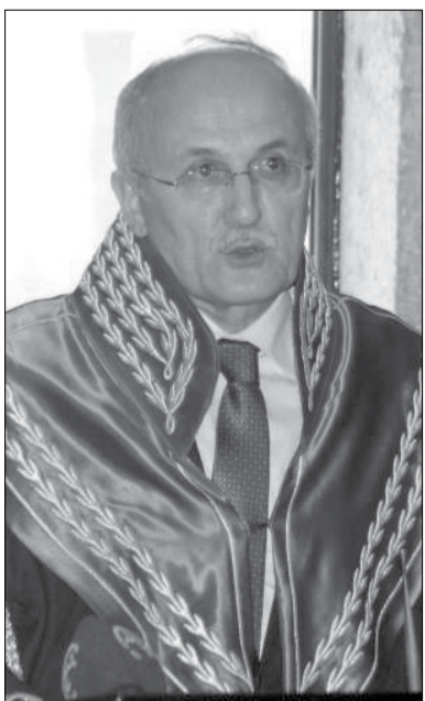
თურქეთის რესპუბლიკის უზენაესი სასამართლოს თავმჯდომარე ალი ალკანი

2014 წლის 12-15 მაისს საქართველოს უზენაესი სასამართლოს მონევით თბილისს თურქეთის რესპუბლიკის სასამართლოს დელეგაცია ეწევა. დელეგაციას თურქეთის რესპუბლიკის უზენაესი სასამართლოს თავმჯდომარე ალი ალკანი ხელმძღვანელობს.