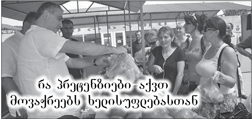
რა პრეტენზიები აქვთ მოვაჭრეებს ხელისუფლებასთან

— უარესობისკენ შეიცვალა ყველაფერი, — ძალიან ბრაზობდა ქალბატონი, რომელიც, წუთის წინ ამოდ ცდილობდა, კლიენტისთვის კიტრი და პომიდორი მიესალმინა, — ყელში გვაქვს გაჭირვება და პრობლემები. ისეთი აგრესიული ვარ, ლაპარაკიც არ მინდა. დაქცეულები ვართ, ყველაფერი გაძვირდა. ხალხს ფული არ აქვს და რა იყიდოს? კატასტროფული მდგომარეობაა, ბანკებმა ამოგვხადა სული. ვერც ვალს ვისტუმრებ, სახლშიც „კაპიკი“ ვერ მიმაქვს. ამით გამო ვენები გადავიჭერთ და სიკეთე არ არის. მთავრობამ ხალხზე უნდა იფიქროს. რაში მაინტერესებს, მილიონები ვინ შეჭამა. არანაირი დახმარება, პენსია არ მეძლევა, ხელფასი არ გვაქვს, ესაა ცხოვრება? ადამიანს რომ ასე უხვად დაუყრი დაპირებებს, ერთი-ორი მაინც შეუსრულე, კაცო. აღარავისი მჯერა. არჩევნებზე აუცილებლად წავალ, მაგრამ რას ვიზამ, არ ვიცი. უკვე ისე ვართ გამწარებული, ვფიქრობ — ის ძველი მთავრობა ხომ უფარგისი იყო და ესენი უარესები გამოდგნენ. ტელევიზორს რომ ვუყურებ, დამტვრევის სურვილი მიჩნდება. წინა პრეზიდენტს გიჟს რომ ეძახდნენ, იმის დროს წესრიგი მაინც იყო. ახლა ვინ ჩაგარტყამს თავში, კაცმა არ იცის. არავის სკამს არ ვიცავ. ელემენტარულ დახმარებას ვითხოვ გლეხებისთვის.