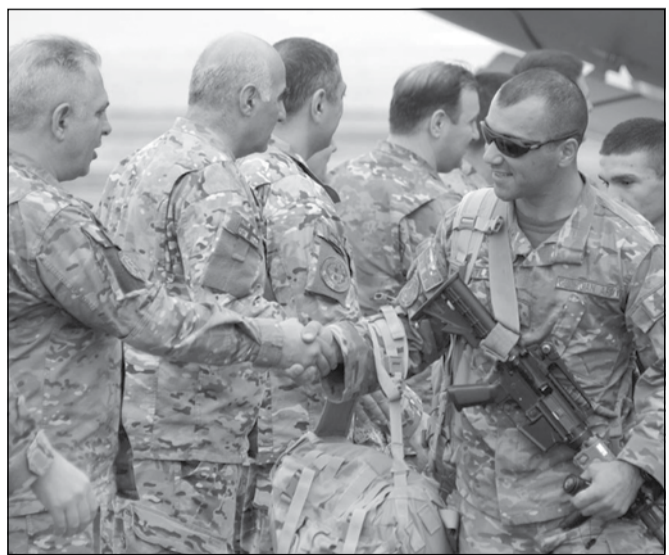
რაიონში ამბოხებულთა ძალების გაუვნებელყოფა, ადგილობრივი მთავრობისა და ეროვნული უსაფრთხოების ძალების განვითარების მხარდაჭერა და უსაფრთხოების ზონების კონტროლი იყო. მესამე ქვეითი ბრიგადის 31-ე ბატალიონის სამხედრო მოსამსახურეები ავღანეთში როტაციის წესით მეორე ქვეითი ბრიგადის 23-ე ბატალიონმა ჩაანაცვლა. რამდენიმე კვირაში 31-ე ბატალიონის სამხედროები სამშობლოში სრულად დაბრუნდებიან.

— პირადად ლევან ბერძენიშვილი ყოველთვის ამბობდა, რომ სამართლიანობა უნდა დამკვიდრდეს. საზოგადოების ნაწილი ითხოვს, ნაციონალური დანაშაულები და მათთვის სამართლიანობა ნუ იქნებითო. ერთ ნაწილს აწყენინო და მეორეს არა, ასე არ გამოვა, რადგან სამართლიანობა და კანონი ყველას მიმართ თანაბრად უნდა მოქმედებდეს. როგორც კი ამას ვამბობ, ამბობენ ნაციონალისტების კაციაო, ამიტომ საქართველოში პოლიტიკოსების არავის შეშურდეს. საქართველოში დემოკრატია რამდენიმე წელიწადში აშენდება. ერთ წელიწადში ვერც ვეროპული ქვეყანა გავხდებით და თუ ვინმე გეტყვი, რომ გაიხსნა ევროკავშირში შევალთ, არ დაუჯეროთ, ხალხო! ანტიდისკრიმინაციული კანონის მიღებითაც იმის თქმა გვსურს, რომ ამ კანონის დონის ხალხი კი არ ვართ, გვინდა, ასეთები ვიყოთ და იდეალებს შევხვდეთ.