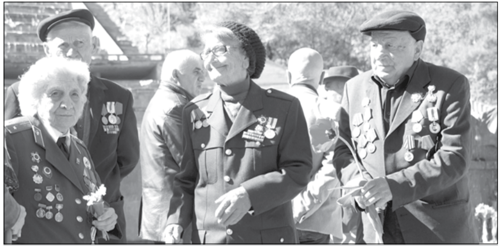
რა საკანონმდებლო ცვლილებების გაყენებას საქართველოს მონაწილეთა პრობლემების გადასაჭრელად