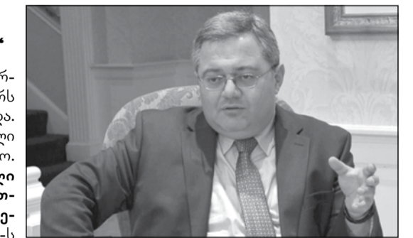
დავით უსუფაშვილი საქართველოსთვის სასარგებლო გადანყვეტილებების მიღებისა. ნიდერლანდების სამეფოს პარლამენტის ორივე სპიკერმა გამოთქვა მზადყოფნა, მათ ხელთ არსებული ყველა შესაძლო საშუალებებით დაეხმარონ საქართველოს შექმნილი რთული ვითარების დაძლევაში. „ინტერპრესნიუსი“

საქართველოს პარლამენტის თავმჯდომარე, დავით უსუფაშვილი ნიდერლანდების სამეფოს პარლამენტის წარმომადგენლობითი პალატის სპიკერს ანუშკა ვან მილტნბურგსა და სენატის სპიკერს, ანკი ბროკერს-ნოლის შეხვდა. მხარეებმა რეგიონში არსებული ვითარება განიხილეს, განსაკუთრებული ყურადღება კი ბოლო დროს უკრაინაში განვითარებულ მოვლენებს დაეთმო. როგორც დავით უსუფაშვილმა აღნიშნა, „უკრაინაში განვითარებული მოვლენების ფონზე, რუსეთის შემდეგი საშიხნი, შესაძლოა, საქართველო გახდეს, ამიტომაც საჭიროა, ვეროკავშირმა რუსეთთან მიმართებაში უფრო მკვეთრი ნაბიჯები გადადგას“. საუბარი ასევე შეეხო ნატო-ს მიმავალ სამიტს, სადაც ქართულმა მხარემ აღინიშნა, „ჩვენს ქვეყანაში დიდია მოლოდინი საქართველოსთვის სასარგებლო გადანყვეტილებების მიღებისა“. ნიდერლანდების სამეფოს პარლამენტის ორივე სპიკერმა გამოთქვა მზადყოფნა, მათ ხელთ არსებული ყველა შესაძლო საშუალებებით დაეხმარონ საქართველოს შექმნილი რთული ვითარების დაძლევაში.