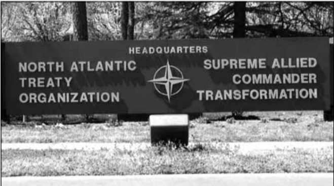
ნატო-ს შტაბბინაში რუსეთის წარმომადგენლებისთვის შეზღუდვების დაწესება

საქართველოს სასაზღვრო უსაფრთხოებისა და პრობაციის მინისტრ სოზარ სუბარის ინიციატივით, ალდგომის ბრწყინვალე დღესასწაულთან დაკავშირებით, 22-23 აპრილს მოქალაქეები ვიდეოკონფერენციის საშუალებით უფასოდ ისარგებლებენ. როგორც „ინტერპრესნიუსს“ სასაზღვრო უსაფრთხოებისა და პრობაციის სამინისტროდან აცნობეს, აღნიშნულ დღეებში, თბილისის, ქუთაისის, თელავის, ახალციხის, ბათუმისა და გორის პრობაციის ოფისებში ვიდეოკონფერენციაში მონაწილეობის საშუალებები სასაზღვრო უსაფრთხოების დანერგვების (ქალთა №5, არასრულწლოვანთა №11 სპეციალური, ქსნის №15 და რუსთავის №17 დანერგვების) მყოფ ახლობლებს გადასახადის გადახდის გარეშე დაუკავშირდებიან. მოქმედი კანონმდებლობით, ვიდეოკონფერენციაში მონაწილეობისას მსაჯულთა და მსჯელობის შემთხვევაში, შეუძლია ნებისმიერ მოქალაქეს. სერვისის ხანგრძლივობა 15 წუთია. ვიდეოკონფერენციის სურვილის შემთხვევაში, მოქალაქეებმა პრობაციის ბიუროებში ნინასნარ უნდა შეავსონ განაცხადი. „ინტერპრესნიუსი“