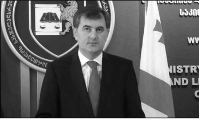
22-23 აპრილს ვიდეოკონფერენციაში მონაწილეობისას

საქართველოს სასაზღვრო უსაფრთხოებისა და პრობაციის მინისტრ სოზარ სუბარის ინიციატივით, ალდგომის ბრწყინვალე დღესასწაულთან დაკავშირებით, 22-23 აპრილს მოქალაქეები ვიდეოკონფერენციის საშუალებით უფასოდ ისარგებლებენ. როგორც „ინტერპრესნიუსს“ სასაზღვრო უსაფრთხოებისა და პრობაციის სამინისტროდან აცნობეს, აღნიშნულ დღეებში, თბილისის, ქუთაისის, თელავის, ახალციხის, ბათუმისა და გორის პრობაციის ოფისებში ვიდეოკონფერენციაში მონაწილეობის საშუალებები სასაზღვრო უსაფრთხოების დანერგვების (ქალთა №5, არასრულწლოვანთა №11 სპეციალური, ქსნის №15 და რუსთავის №17 დანერგვების) მყოფ ახლობლებს გადასახადის გადახდის გარეშე დაუკავშირდებიან. მოქმედი კანონმდებლობით, ვიდეოკონფერენციაში მონაწილეობისას მსაჯულთა და მსჯელობის შემთხვევაში, შეუძლია ნებისმიერ მოქალაქეს. სერვისის ხანგრძლივობა 15 წუთია. ვიდეოკონფერენციის სურვილის შემთხვევაში, მოქალაქეებმა პრობაციის ბიუროებში ნინასნარ უნდა შეავსონ განაცხადი. „ინტერპრესნიუსი“