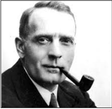
ელვინ ჰაბლი (1889-1953).

ელვინ ჰაბლიმ 1923 წელს დაამტკიცა, რომ სამყარო ჩვენს გალაქტიკაზე – რძიანი გზა (ირმის ნახტომი) – უფრო დიდია. 1925 წელს შექმნა გალაქტიკების კლასიფიკაციის სქემა. 1929 წელს ნათლად აჩვენა, რომ სამყარო იზრდება. 1936 წელს გამოაქვეყნა წლის ყველაზე პოპულარული სამეცნიერო წიგნი „ნისლეულის სამეფო“. 1990 წელს უზარმაზარ ორბიტალურ ტელესკოპს ჰაბლის სახელი დაარქვეს.