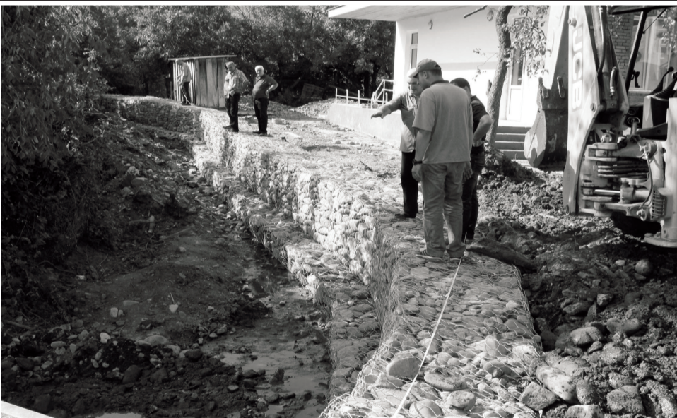
ხაშურის მუნიციპალიტეტის სოფელ ბრილში, საჯარო სკოლის მიმდებარე მდინარე ბულთურაზე ნაპირსამაგრი გაბიონების მოწყობა მიმდინარეობს. სამუშაოები ადგილობრივი ბიუჯეტიდან ფინანსდება.

ბისა არ იყოს, ისრებს ცალ-ცალკე იოლად რომ ამტვრევდნენ, ხოლო როცა ერთ კონად შეკრეს, ვერაფერს უხერხებდნენ. ძალა ჩვენში და ერის ერთობაშია. სხვის იმედად ყოფნა კარგს არაფერს მოგვიტანს. შორია ნატომდე! ახლა საუბარი მიდის დაქირავებული ჯარის შექმნაზე(!) რაშია საქმე? დაქირავებული და ფულით დაინტერესებული პიროვნება (თუ ის ქართველი არ არის), როგორ გადაეგება სამშობლოს ქართველზე უკეთ, როგორ დაიცავს საქართველოს? ეს საკითხის ერთ-ერთი მხარეა, მაგრამ ამ დაქირავებულის, ასეთი ჯარის შენახვის თავი გვაქვს(!) მიეცი ხალხს საკმარისი ხელფასი, პენსია და მერე ნახეთ როგორი დამცველები, ჯარისკაცები ეყოლება სამშობლოს(!) „ქართველი ომში მგელია, შრომაში ხარი ნიკორა, და მაინც ქვეყნის ფორანი, სულ თავდადმართში მიგორავს“(!!) თუმცა, ისევ „დაიზრდებიან ალგეთს ლეკები მგლისანი“ და მაშინ: „ვიცი, გადაივლის სეტყვა და წვიმა, დრო მოგვიშუშებს ყველა იარას და აღივსება ისევ ბადავით, ჩემო ქვეყანავ, შენი ფიალა(!) ან: „მზე ჩავა, მზე კვლავ ამოვა, უფრო დიდი და ჩახნახა“ (გ. ლეონიძე) ღმერთმა ინებოს, ასე ყოფილიყოს ხვალინდელი საქართველო! რ. სავანელი