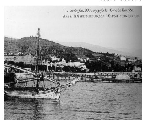
11. სოხუმი. XX საუკუნის 10-იანი წლები Akca. XX ашышыксы 10-тан ашыкаксы