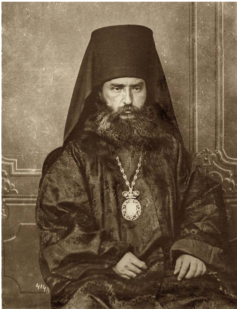
იმერეთის ეპისკოპოსი და აფხაზეთის ეპარქიის მმართველი წმ. მღვდელმთავარი გაბრიელი