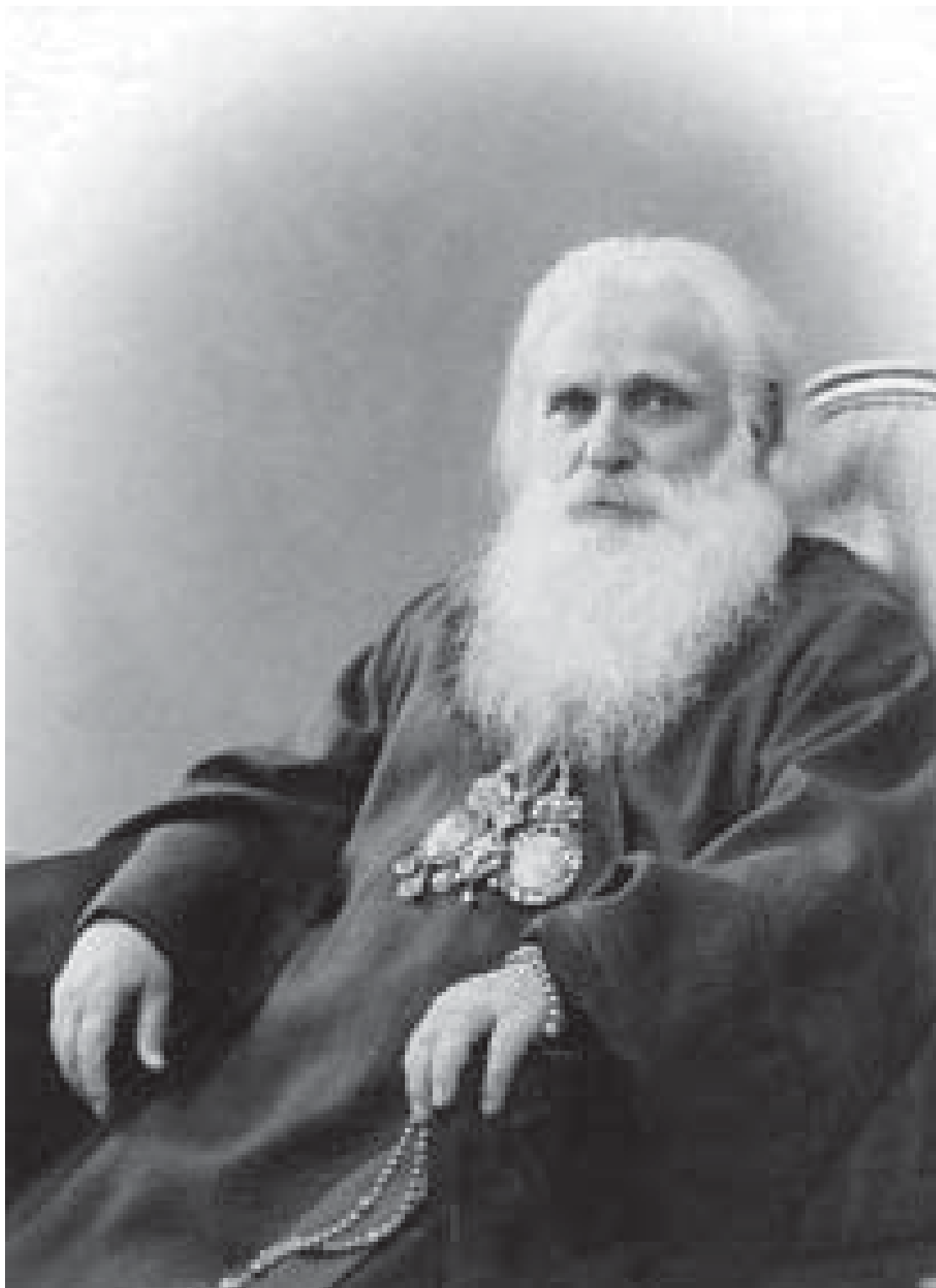
უწმინდესი და უნეტარესი სრულიად საქართველოს კათოლიკოს-პატრიარქი ამბროსი (ხელაია) სიცოცხლის ბოლო დღეებში.