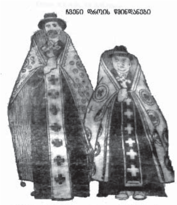
ჩხეიძის დროის წმინდანები