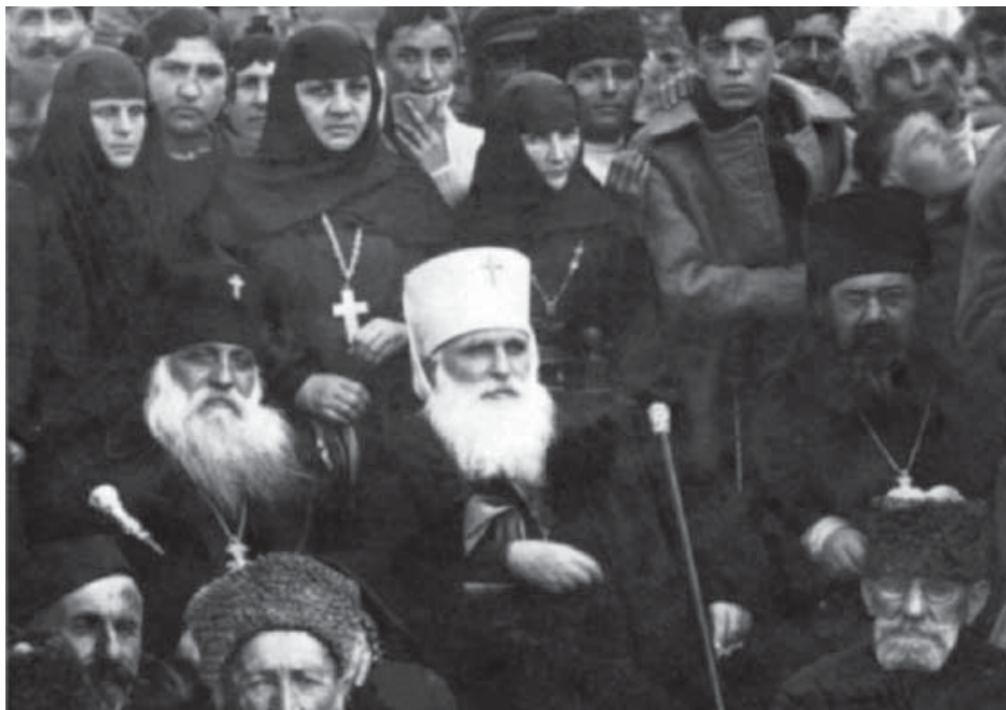
წმინდა ამბროსი კათოლიკოს-პატრიარქად კურთხევის დღეს. მცხეთა, 1921 წ. 14 ოქტომბერი.