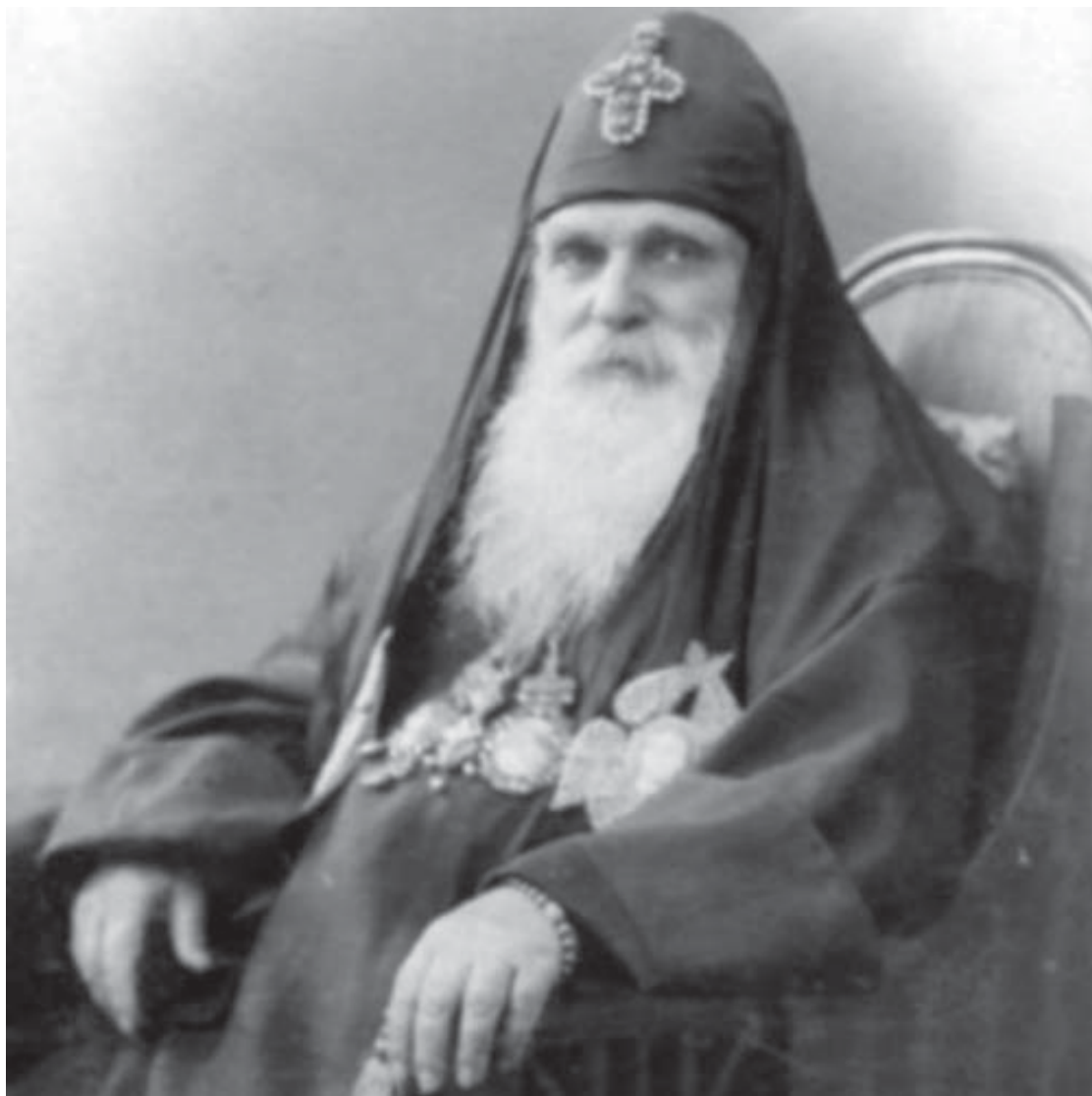
უნმინდესი და უნეტარესი სრულიად საქართველოს კათოლიკოს-პატრიარქი ამბროსი (ხელაია).