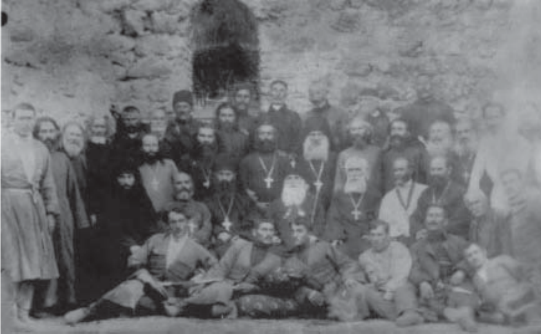
კათოლიკოს-პატრიარქ ამბროსი ხელაიას სტუმრობა კახეთში ალავერდობაზე. 1922 წ.

19 სექტემბერს დაგეგმილი იყო შუამთის მონასტერში გამგზავრება, სადაც მისი უნ- მინდესობა მეორე დღეს ღამისთევით ლოცვას, 21 სექტემბერს – საღვთო ლიტურ- ლიას ჩაატარებდა. შემდგომ დღეებში კათოლიკოს-პატრიარქი აპირებდა ძველი შუამ- თის (22 სექტემბერი), იყალთოს ღვთაების (23 სექტემბერი), თეთრი გიორგის (24 სექტემბერი) და ახლომდებარე სოფლების ეკლესიების დათვალიერებას; 26 სექტემ- ბერს გაემგზავრებოდა ალავერდში, სადაც შეხვდებოდა მღვდელმონაზვნებს, ახლომ- დებარე სოფლების სამღვდლოებას და მოსახლეობის წარმომადგენლებს. 27 სექტემ- ბერს ალავერდში გაიმართებოდა ღამისთევითი ლოცვა, 28 სექტემბერს – საღვთო ლიტურდია (იხ: ალავერდობაზე გადაღებული ფოტო).