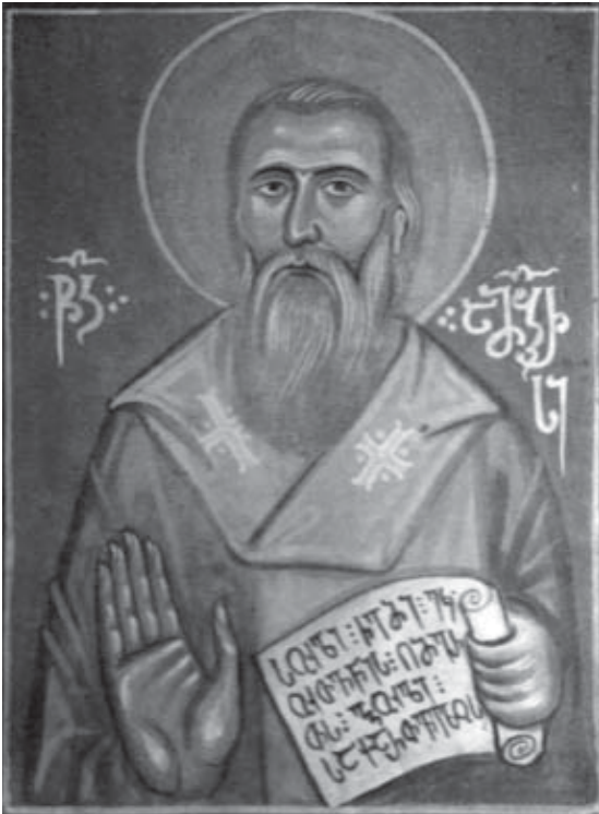
ნმ. აღმსარებელი ამბროსის ხატები