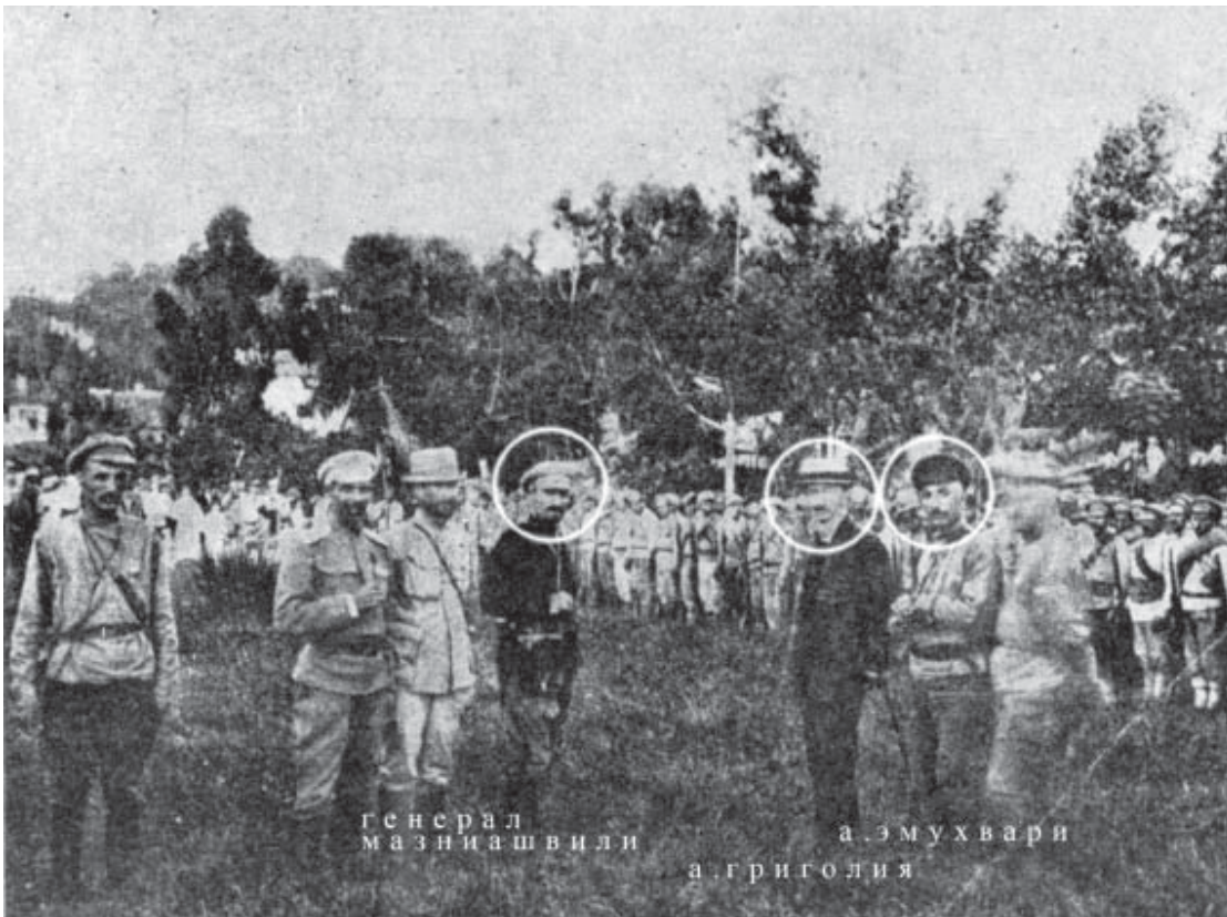
ქართული ჯარები სოჭში. 1918 წლის შემოდგომა.