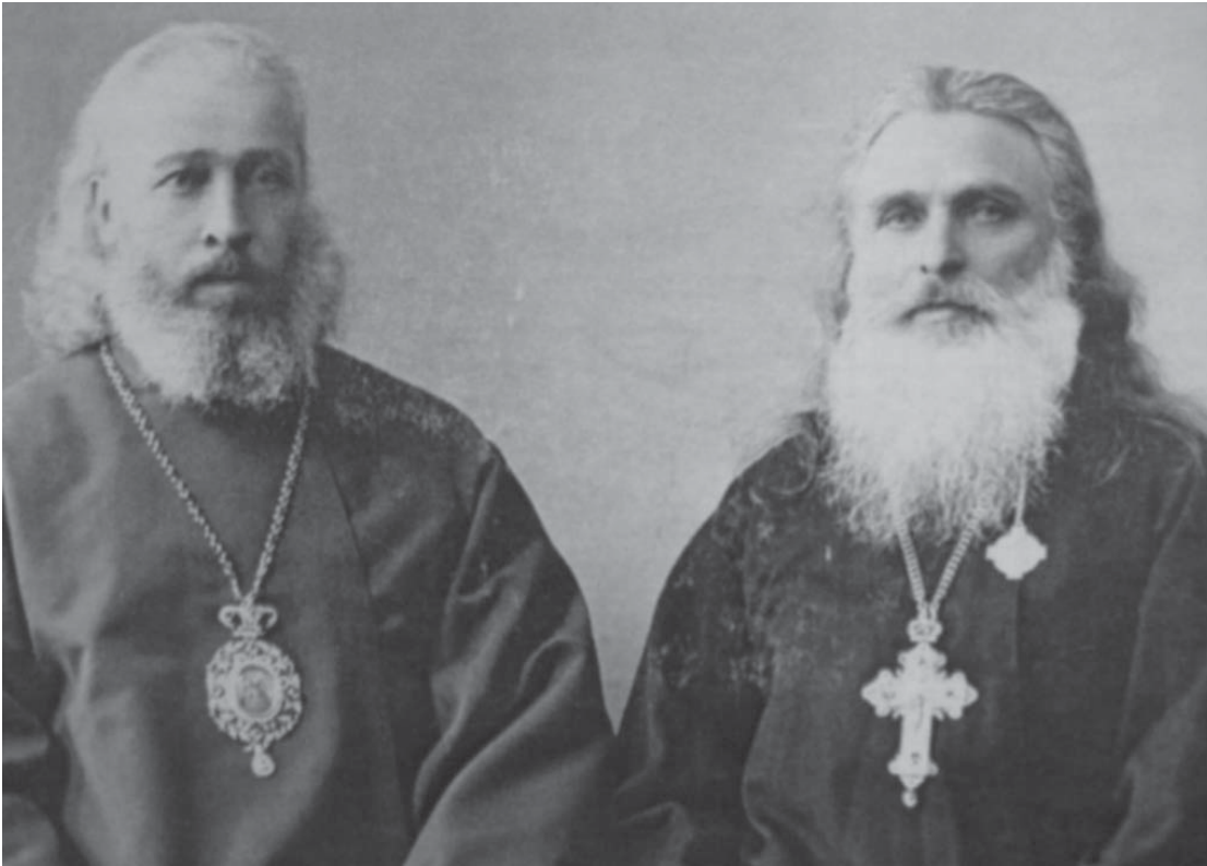
ეპ. კირიონი და არქ. ამბროსი. ქ. პეტროგრადი, 1910 წ.