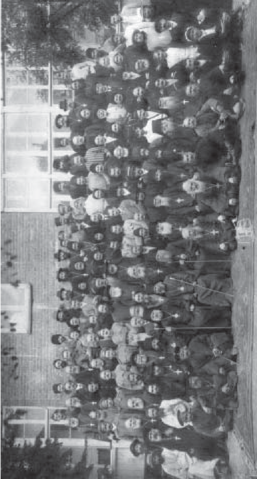
1917 წ. სექტემბერი. მეორე რიგში, მარჯვნიდან მეშვიდე კათოლიკოს-პატრიარქი კირიონ II, მეორე – მიტროპოლიტი ლეონიდე, მეცხრე – აშროსი ხელაია საქართველოს საეკლესიო კრების მონაწილეთა შორის.