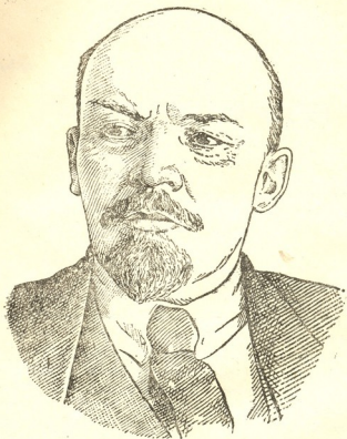
ვლადიმერ ილიას-ძე ლენინი